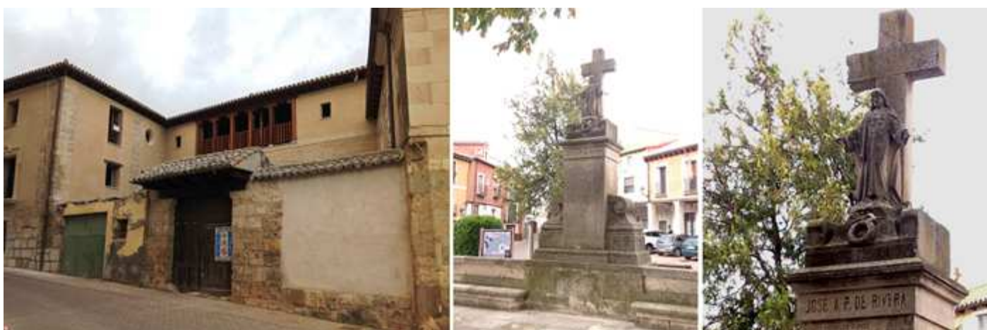
❶ Construcción colindante al palacio de José I ❷ En la plaza de la Iglesia se encuentra el monumento a los Caídos de la Guerra Civil. ❸ Con una cruz y ante la misma la imagen del Sagrado Corazón de Jesús.