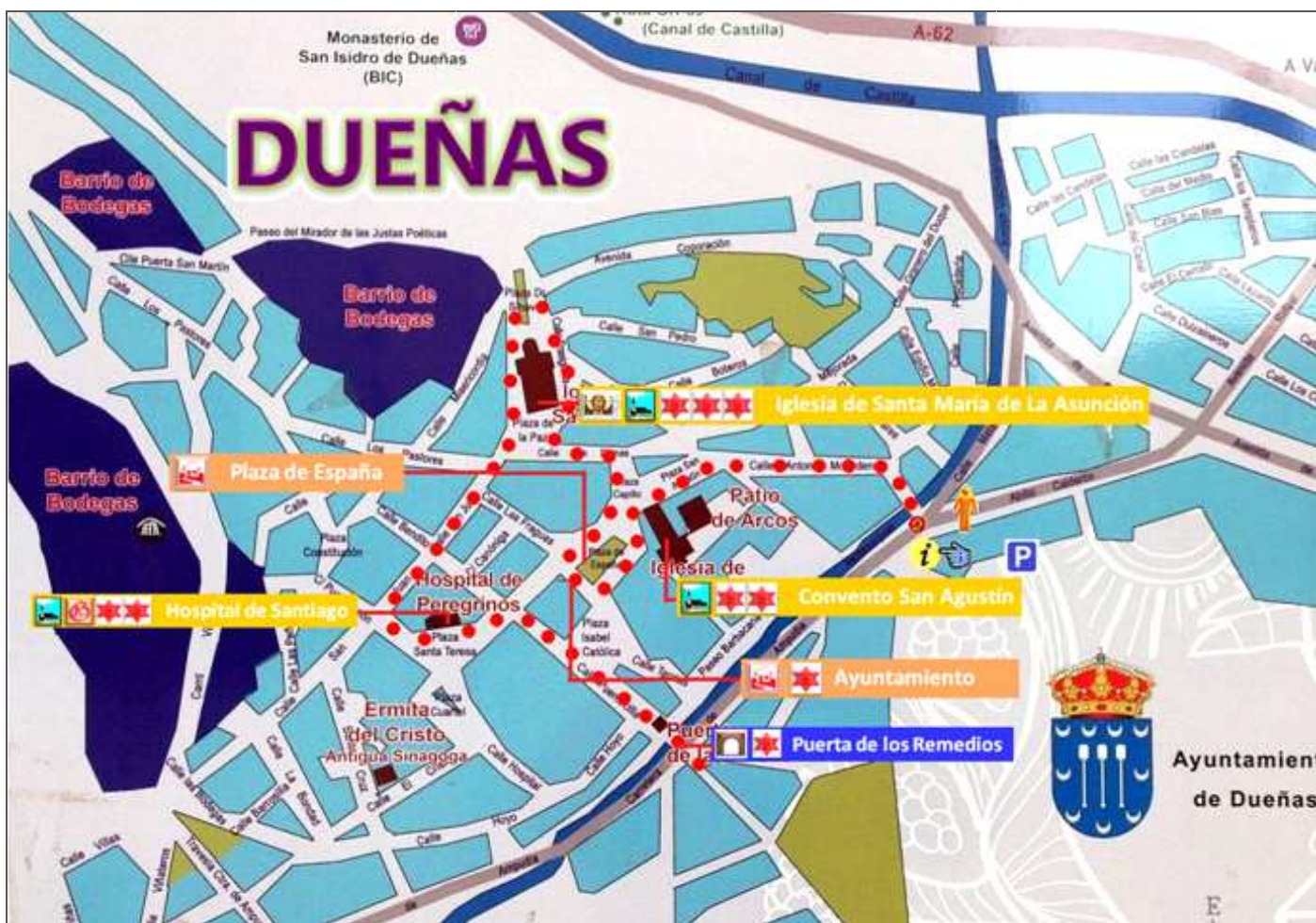
Croquis itinerario visitas, plano empleado de un panel informativo.