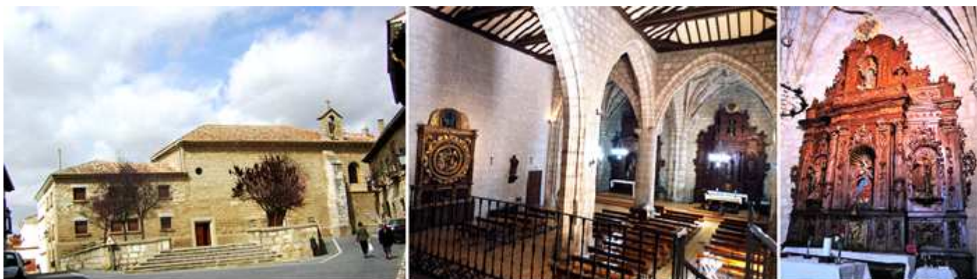
❶ Plaza de Santa Teresa con la iglesia del Hospital. En la portada de la iglesia sobre su puerta ostenta el escudo de los Condes de Buendía. ❷ Vista de la nave del Evangelio y la cabecera desde el Coro. ❸ Retablo Mayor de la Anunciación sin dorar de tres calles.

De este hospital de finales del S. XV, se conserva su iglesia que actualmente mantiene el culto y que en sus instalaciones es una residencia de ancianos. Este es el único que sobrevivía de los tres que llegó a contar la ciudad. Y que paso a estar bajo el patronato de los I condes de Buendía por bula papal de Sixto IV.