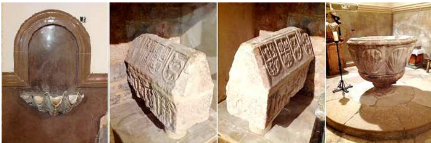
❶ Pila agua bendita, con una gran concha marina encastrada en el muro a la derecha de su entrada, por la puerta principal. ❷ Sepulcro gótico de la casa real castellana. Sepulcro gótico de la casa real castellana. S. XIV. ❸ Posee los escudos de: Juan de Tarifa el de Castilla (escudo de las águilas y los leones), y de María Díaz de Haro (escudos de los lobos). Alfonso de Portugal (escudo con las quinas portuguesas) y de Violante Manuel, hija del infante Manuel de Castilla (escudo con los leones y las alas sosteniendo una espada). Por lo que sería un descendiente de corta edad. Y con escenas de plañideras. ❹ Pila bautismal de traza troncocónica lobulada sobre un pie, cada faceta de su frontal está decorada con una concha, su parte inferior con perfiles excavados gallonados sobre una basa redonda encastrada en el suelo. Se traslado a esta capilla (antigua de San Idelfonso) desde el interior del templo.

Una vez recorrida toda su parte exterior entramos en el templo, a la izquierda junto el retablo de la Santísima Trinidad se encuentra un sepulcro gótico de la casa real castellana, y bajo la torre está la capilla bautismal. Esta era la antigua capilla de San Idelfonso donde se encuentra su pila de gran tamaño, gallonada octogonal del S. XVIII y la escultura de San Pedro del S. XVIII.