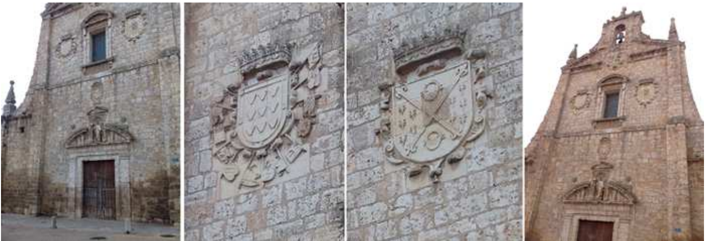
❶ Fachada del templo con una puerta adintelada con un frontis curvo abierto sobre la misma. ❷ Armas de los Acuña, condes de Buendía. ❸ Armas de los Acuña y Manrique, condes de Santa Gadea y de Buendía. ❹ Además de los escudos a los lados de su ventana esta coronada esta fachada con una espadaña de un vano para su campana, todo ello enmarcado con unos gruesos contrafuertes culminados con pináculos

Su templo es de una sola nave con estilo viñolesco que difundió Juan de Herrera por España, con planta de cruz latina de tres cuerpos más crucero y cabecera poligonal.