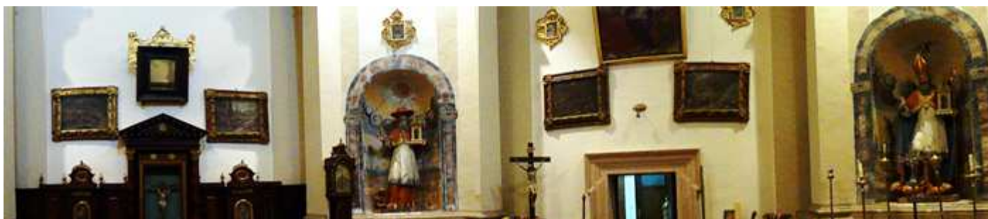
❶ Panorámica de la sacristía, sala con forma octogonal cubierta por una cúpula.

A continuación entramos en su museo con orfebrería donada por los Condes de Buendía, ropa litúrgica, y una escultura de Ecce Homo de Diego de Siloé entre los diversos objetos.