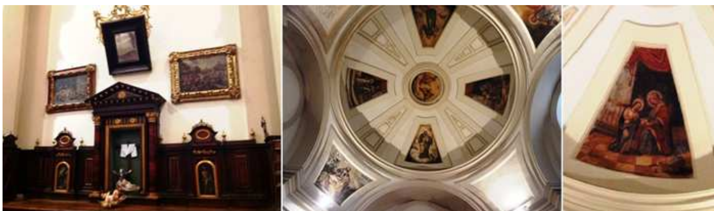
❶ Y la que se encuentra a la derecha de la sala. ❷ Posee un cúpula sobre trompas que sus gajos están decorados con pinturas. ❸ Con escenas de la Virgen San José, San Antonio de Padua, las Santísima Trinidad.....