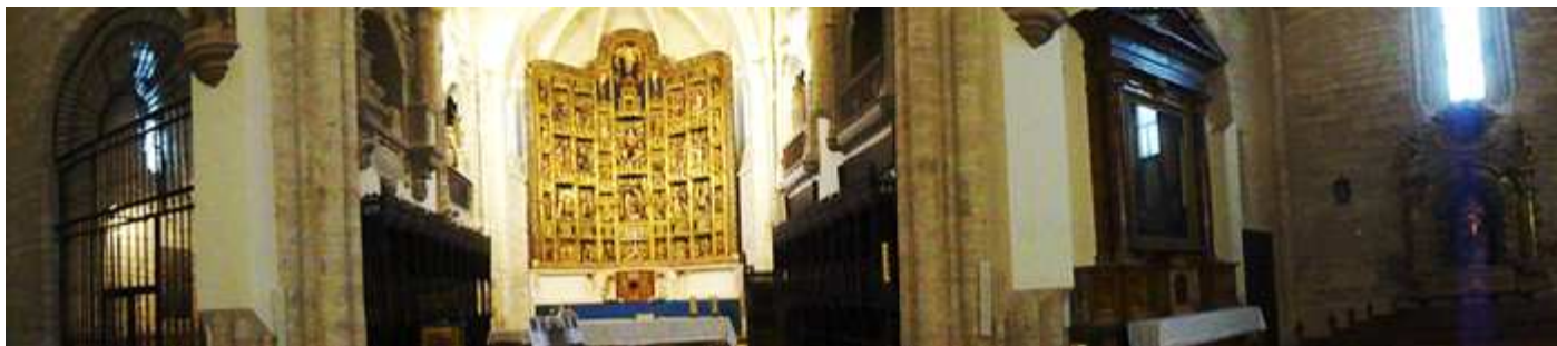
❶ Panorámica de la cabecera a la izquierda la reja de origen vizcaíno de mediados del S. XVII, que cierra la capilla del Santísimo, la capilla mayor y los dos retablos de la Inmaculada.