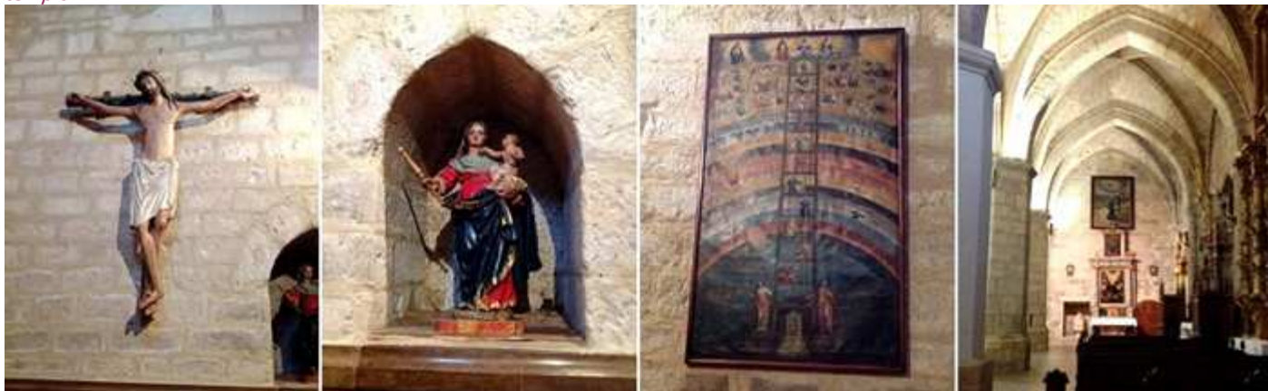
1 Santo Cristo de las Ánimas del S. XIII. 2 Virgen con el Niño S. XVIII. 3 Cuadro de Itinerario Místico de la capilla bautismal. 4 La nave del Evangelio desde la cabecera.

Tras observar la capilla del Santísimo donde apreciamos la parte románica con su ventanal que posee capiteles decorados con formas bulbosas, incluyendo figuración de arpías y cuadrúpedos... Llegamos a la capilla Mayor con un retablo tardo gótico.