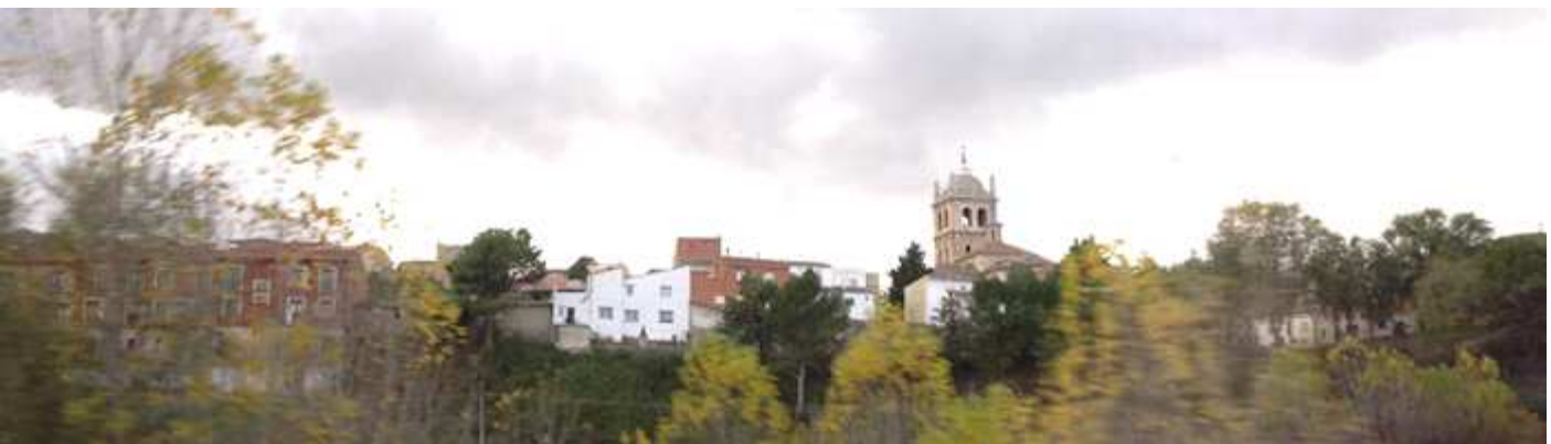
1 Panorámica de esta ciudad, cuyo título se lo otorgó el rey Alfonso XIII en el año 1928.

A tan solo 20km de la capital palentina se encuentra esta localidad, que está a la vera del Canal de Castilla y su vega entre los ríos Carrión y Pisuegra. Con un casco antiguo merecedor de estar declarado Bien de Interés Cultural. Con las construcciones típicas castellanas con sus soportales y las bodegas horadadas en el cerro local.