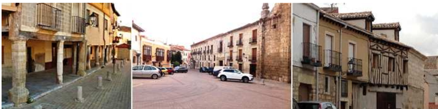
❶ Lateral con soportales en el lado izquierdo de la plaza. ❷ La plaza de España se prolonga con la plaza de San Agustín. ❸ Edificio típico de construcción de ladrillo y madera en su casco antiguo.

Esta amplia plaza donde se construyera el palacio de María Molina en 1440 y algunos otros. Los restos de este palacio se encuentran en el lateral derecho de la plaza según se ve desde el ayuntamiento.