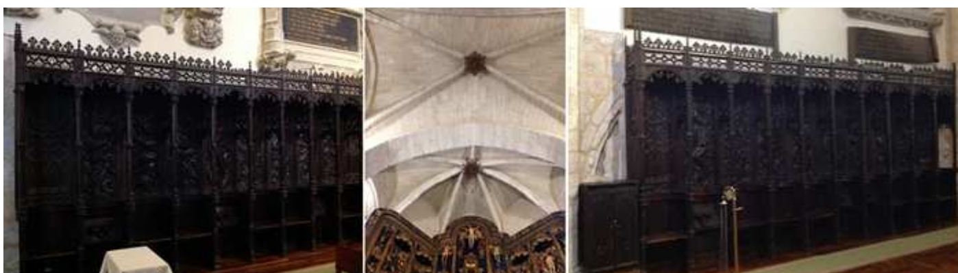
❶ La sillería es del 1500, y tiene en su decoración influencias de las Indias, que acababan de ser conquistadas. ❷ Detalle de la crucería y del arco triunfal de la capilla Mayor. ❸ Lateral derecho en el lado epistolar. Se conservan del conjunto de sillas altas y bajas dos series de diez sitiales, cuyos respaldos están labrados con bajorrelieves de figuras entre follaje y composiciones geométricas góticas. Con influencias de los viajes americanos de las conquistas.

En los laterales del presbiterio se encuentra los sepulcros de los Acuña.