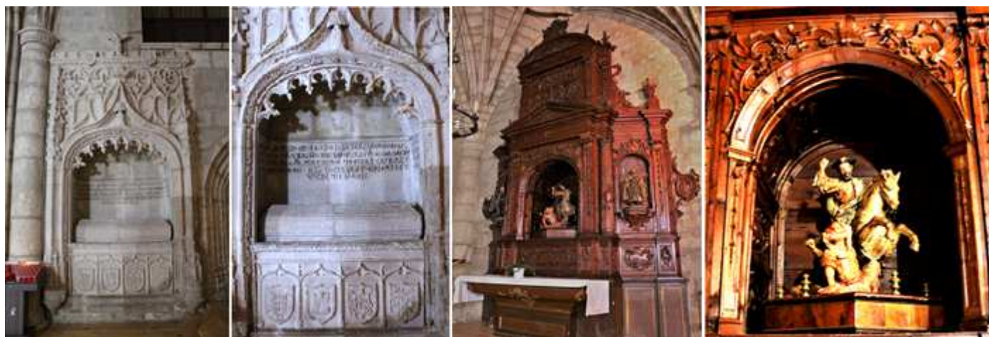
❶ Sepulcro gótico de Luis de Acuña, hijo de los I condes de Buendía ❷ El sepulcro dentro de un arco rebajado con crestería, con la inscripción en los tres laterales interiores y en su frontal con cuatro escudos nobiliarios. †1522. ❸ En la cabecera de esta nave le retablo barroco de 1775 sin policromar en cuya parte central se encuentra la escultura ecuestre de Santiago matamoros, talla anónima. ❹ Talla del apóstol Santiago a caballo y tocado con sombrero de ala ancha. .

En la nave del Evangelio se encuentra el monumento funerario de Luis Acuña que junto con su padre, instituyó este hospital de Santiago y San Sebastián.