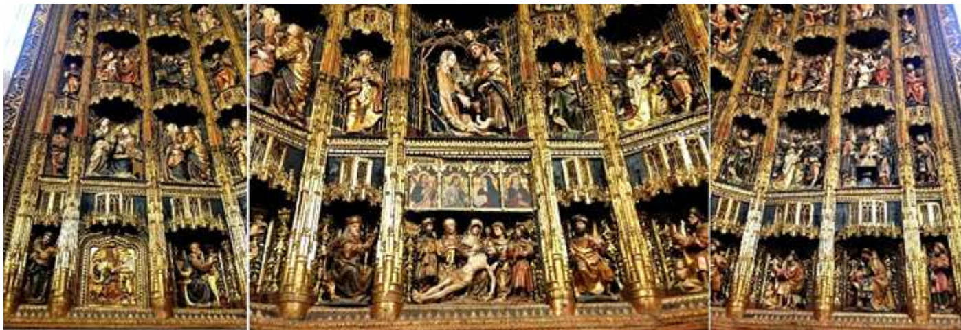
❶ El retablo se compone de banco, tres cuerpos y remate, con guardapolvo; Cinco calles con escenas de la Vida de Cristo. ❷ En el banco Llanto de Cristo muerto, reyes, profetas bíblicos y los cuatro evangelistas. Las pinturas de una época anterior la Natividad, la Asunción y el Calvario son de ❸ En sus laterales y entrecalles los apóstoles, santo y los profetas.