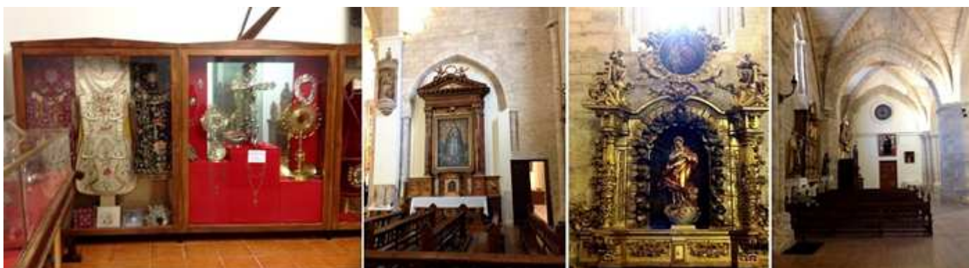
❶ Vitrina con diversos trajes litúrgicos hay un terno con el escudo del conde de Acuña. Y cruces y custodias. ❷ Retablo de la Inmaculada junto a la puerta de sacristía. ❸ Retablo de la Inmaculada en el lateral de la nave epistolar. Talla de Jerónimo López. ❹ La nave epistolar desde la cabecera. A los pies la pintura del beato Lucio y Cristo del Rosario.

Llegamos a la puerta del Epístola, llamada puerta del Sol del XVIII