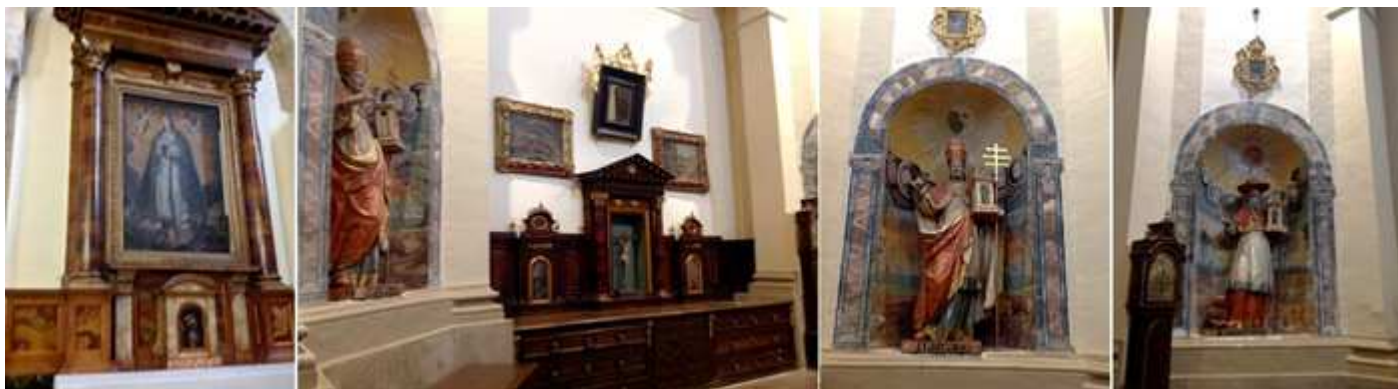
❷ Antes de entrar en la sacristía a la izquierda se encuentra el retablo de la Inmaculada. ❸ Dispone de dos grupos de cajoneras neoclásicas. ❹ San Gregorio (con la mitra papal) ❺ San Gerónimo (con el capelo cardenalicio), con un reloj de antesala.

En ella hay seis pinturas flamencas neoclásicas anónimas del la segunda mitad del S. XVII con escenas de la Pasión de Cristo en cinco de ellas y la sexta de la batalla de Clavijo.