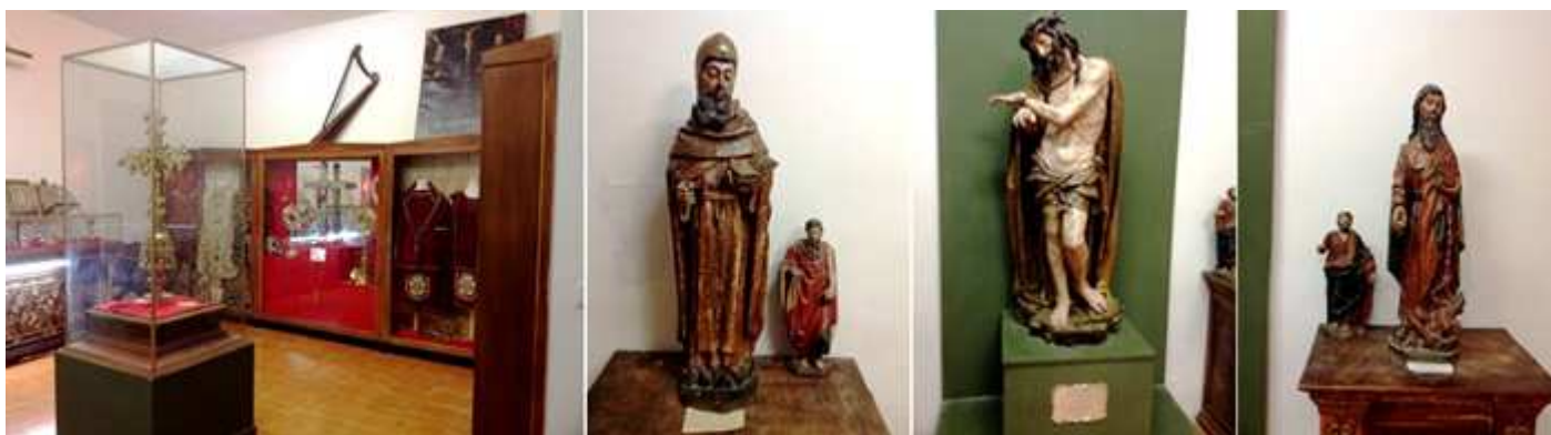
❷ En la parte central una cruz procesional. ❸ San Antón del S. XVI. ❹ Ecce Homo, talla de Diego de Siloé. ❺ San Bartolomé S. XVI.

A continuación entramos en su museo con orfebrería donada por los Condes de Buendía, ropa litúrgica, y una escultura de Ecce Homo de Diego de Siloé entre los diversos objetos.