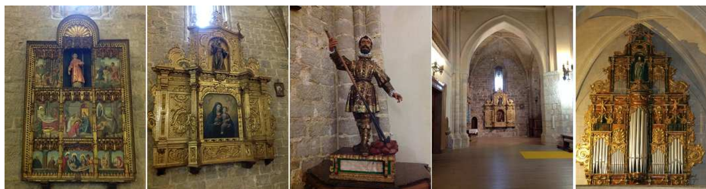
❶ A continuación de la puerta, se encuentra el retablo de San Idelfonso, del Maestro de Becerril, primer tercio S. XVI de tres cuerpos con pinturas sobre tabla. ❷ Retablo barroco de la Virgen del Pópulo, del S. XVIII y sobre ella San Francisco de Asís. ❸ m. ❹ Vista frontal del retablo de San José, en la nave del Evangelio. ❺ Órgano sobre el pórtico de entrada con el coro, de 1754.

Llegamos a la puerta del Epístola, llamada puerta del Sol del XVIII