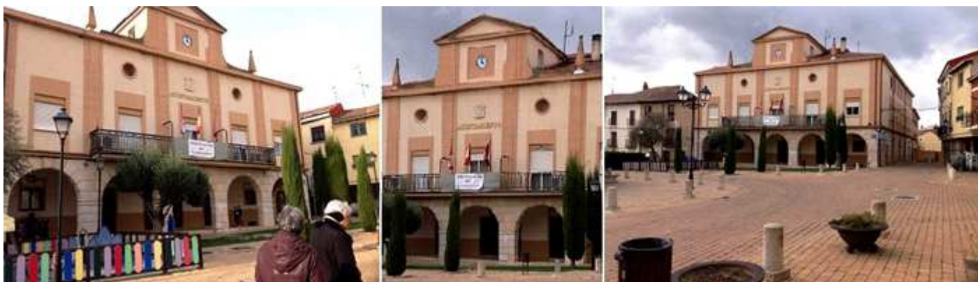
❶ Dispone de un pórtico compuesto por cinco arcadas de medio punto y tres alturas. ❷ Cuerpo central donde ostenta un balcón corrido en su planta noble. ❸ La plaza de España con el Ayuntamiento.

Esta plaza de España también se llama del mercado.