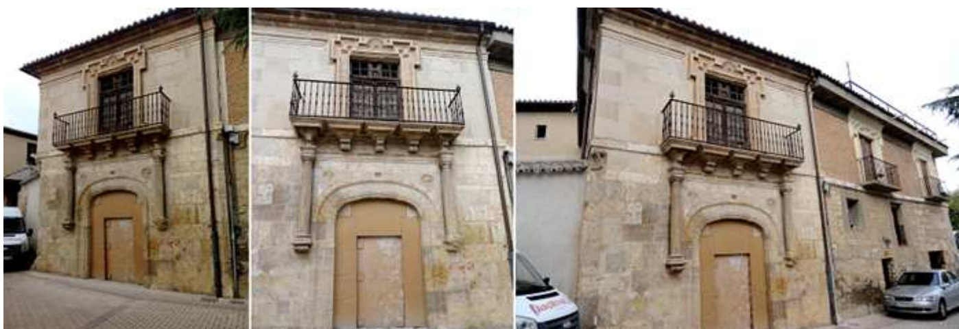
❶ En esta casa que se encuentra en la Plaza Dr. Sinova nº 3 (en el lateral de la iglesia de Santa María) parece ser que se alojó José I en esta casona. ❷ Este edificio que su planta baja corresponde al S. XVI y la superior al S. XVIII. ❸ Dispone de una puerta de arco rebajado que posee dos medallones en relieve en los ángulos superiores del arco enmarcada con dos columnas estriadas a media altura y sobre ella un balcón sostenido por cinco ménsulas en su planta noble.

Concluimos la visita, para proseguir el recorrido en la parte posterior de la iglesia se encuentra... la casa de Napoleón, al alojarse el mismo durante la Guerra de la Independencia de 1808.