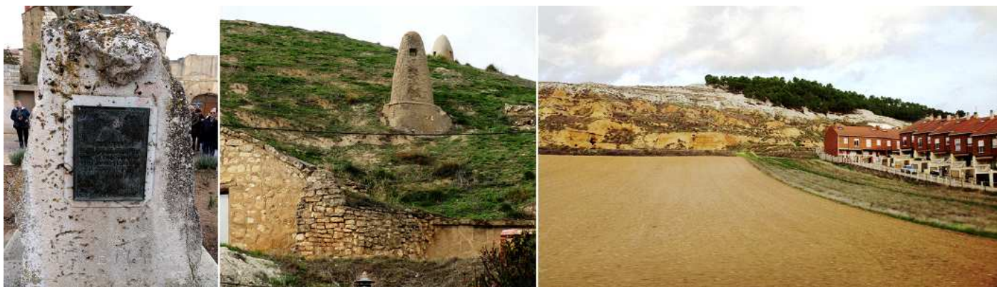
1 Monumento a Carlos V. Cuando pasó por estas tierras en su retiro a Yuste. 2 En la loma de la ciudad se conservan una cantidad importante de bodegas y cuevas. 3 Panorámica de entrada a la ciudad.

Arco gótico del S. XIV-XV ojival, en la parte superior se encuentra alojada la ermita de la Virgen. Para acceder a la ermita a la izquierda del arco hay una escalera lateral.