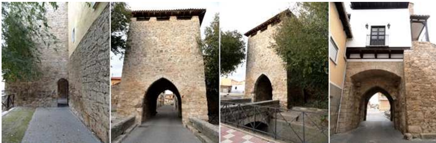
1 Lateral de las murallas con el bloque de la puerta que sobre sales de los lienzos. 2 Imagen de su parte frontal con un doble arco apuntado. 3 Perspectiva de la puerta ante el puente del arroyo Valdesanjuan. 4 Parte posterior con el balconcillo de la ermita donde se exhibe a la Virgen en las Fiestas Patronales.

Arco gótico del S. XIV-XV ojival, en la parte superior se encuentra alojada la ermita de la Virgen. Para acceder a la ermita a la izquierda del arco hay una escalera lateral.