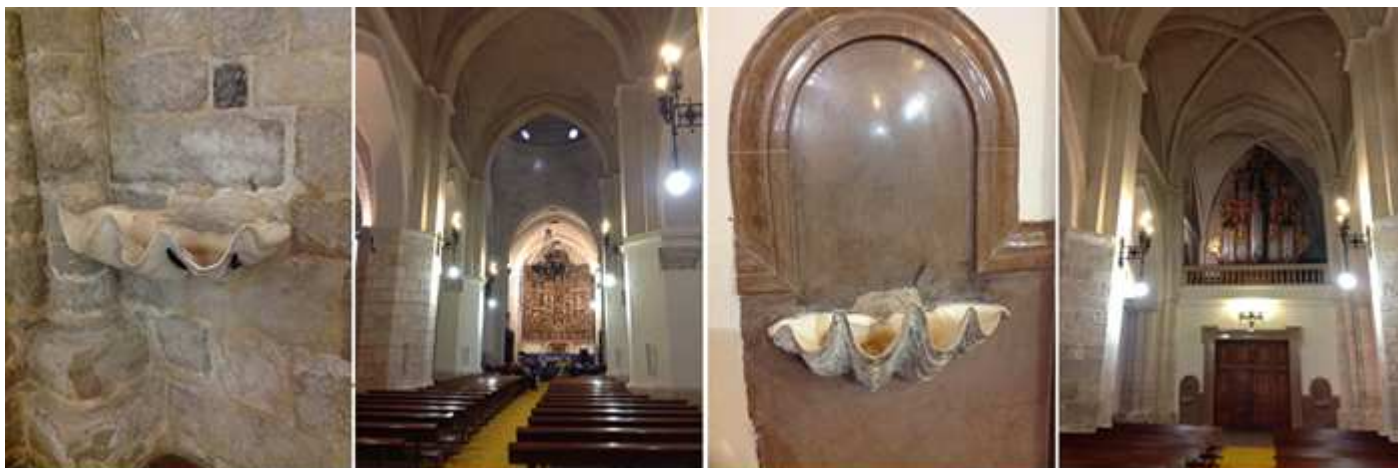
❶ Pila agua bendita, con una gran concha marina encastrada en el muro a la entrada por la puerta por la puerta del Sol en el lado epistolar. ❷ Nave central de templo con sus arcos sobre gruesas pilastras. ❸ Pila agua bendita con una gran concha marina encastrada sobre el muro de los pies del templo a la derecha de la puerta principal sobre una superficie aplacada en arco de mármol marrón. ❹ El coro con el órgano sobre la puerta de los pies del templo.

Lo más tardío del templo es el cimborrio que data del siglo XVI y siglo XVII. Y su órgano es de 1754 obra de José Ballesteros.