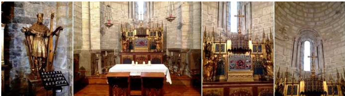
1 A la izquierda del retablo la talla del Rey David con el arpa. 2 En la cabecera de la nave del Evangelio se encuentra la capilla del Santísimo. 3 Altar con restos de materiales góticos. 4 Capilla con bóveda de horno, posiblemente sea la parte más antigua del templo.