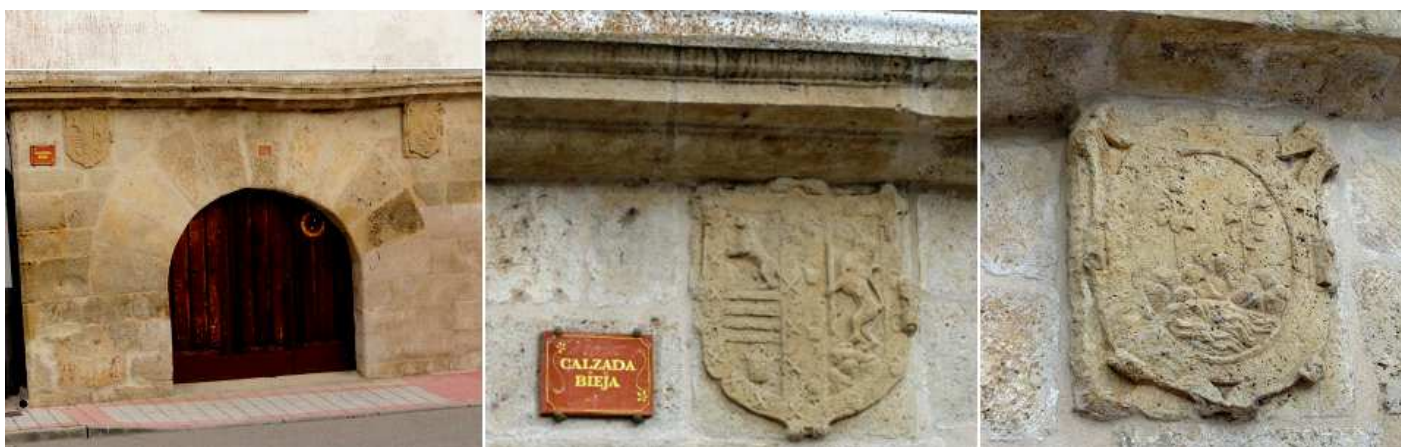
❶ Casa con una puerta de arco de medio punto de grandes dovelas lisas y que a sus lados dispone de dos escudos. ❷ El escudo izquierdo de esta casa que posee en sus cuarteles leones rampantes junto con barras y calderos. ❸ El escudo de la derecha esta recorrido por un cordón, y dentro de su óvalo aguas y sobre tierra dos arbustos.

Otra de sus casas nobiliarias es la Casa de las Tercias.