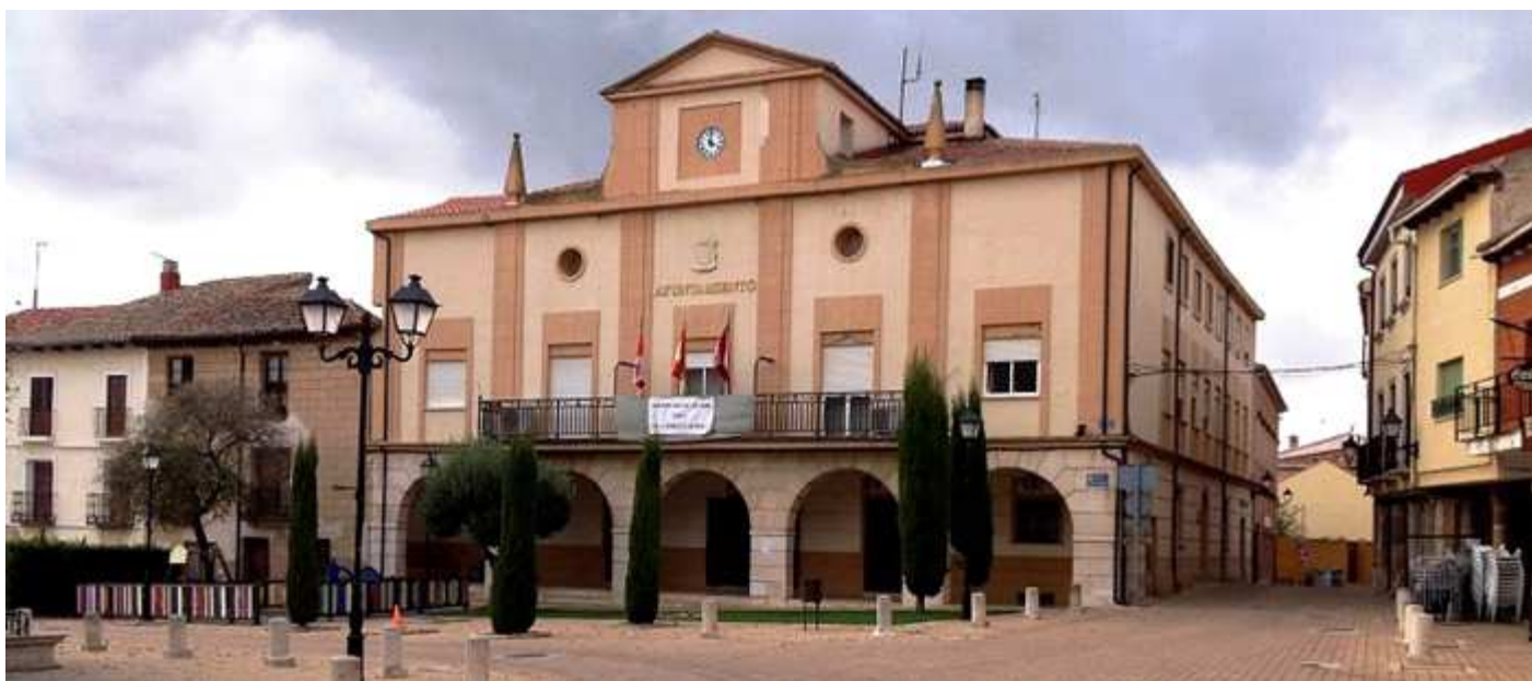
❶ Fachada de la Casa consistorial. Sobre su fachada ostenta el escudo local con las armas de los Padilla, formado por "tres palas de horno (o padillas) con los mangos hacia abajo".

Esta plaza de España también se llama del mercado.