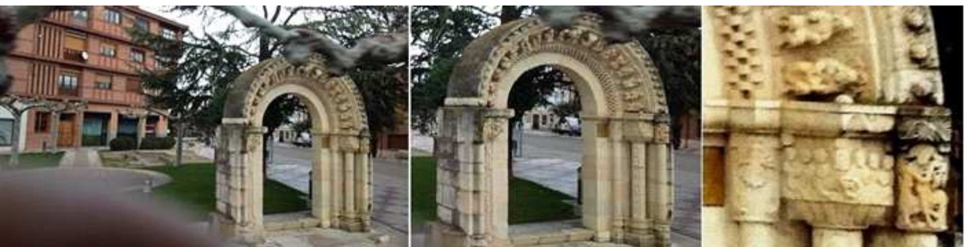
1 Avda. Valladolid, Arco neo románico. 2 Compuesto por una arquivolta interior de tajeado jaqué la intermedia decorada con personajes en sus dovelas y protegida con un guarda polvo a bolas. 3 Sus capiteles son historiadados.

En su centro destacan las construcciones de las casas nobiliarias y de sus templos como testigos de su pasado. Dueñas está situada en el camino Real de Valladolid a Burgos, o en la calzada romana de León a Zaragoza. Y fue asolada por Almanzor en 981 y 984 y repoblada por Alfonso III el Magno en el S. IX. Fue Villa realenga.