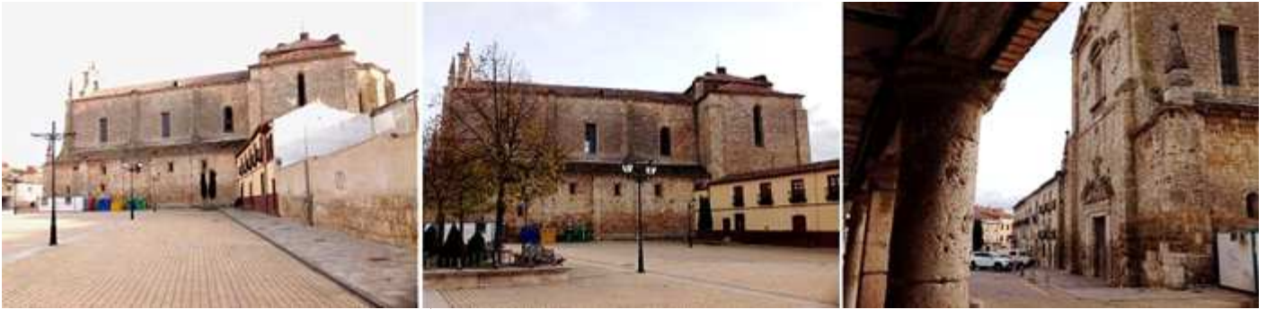
❶ Lateral exterior de la iglesia de San Agustín que da a la Plaza de España. ❷ A ambos lados de la nave entre los contrafuertes estaban sus capillas. ❸ Fachada desde los soportales de la plaza de España y la plaza de San Agustín.

Se conserva su iglesia que es del S. XVI y parte del claustro. La comunidad de agustinos existía ya desde el S. XIII, y se instaló a principios del XV dentro de la ciudad.