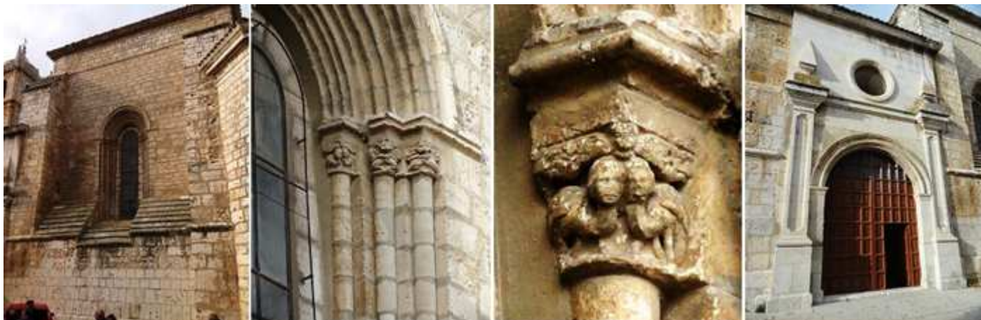
❶ Otra de las ventanas góticas de la nave, en este caso de medio punto. ❷ Con sus capiteles historiados. ❸ Uno de sus capiteles con una pareja de arpiás enfrentadas con cabezas humanas y sobre ellas una ángel con las alas desplegadas. ❹ Puerta del Sol en este lado de la Epístola.

Una vez recorrida toda su parte exterior entramos en el templo, a la izquierda junto el retablo de la Santísima Trinidad se encuentra un sepulcro gótico de la casa real castellana, y bajo la torre está la capilla bautismal. Esta era la antigua capilla de San Idelfonso donde se encuentra su pila de gran tamaño, gallonada octogonal del S. XVIII y la escultura de San Pedro del S. XVIII.