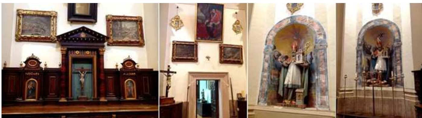
❶ Detalle de la cajonera de la izquierda. ❷ Puerta de acceso al museo. ❸ San Agustín, ❹ San Ambrosio.

En ella hay seis pinturas flamencas neoclásicas anónimas del la segunda mitad del S. XVII con escenas de la Pasión de Cristo en cinco de ellas y la sexta de la batalla de Clavijo.