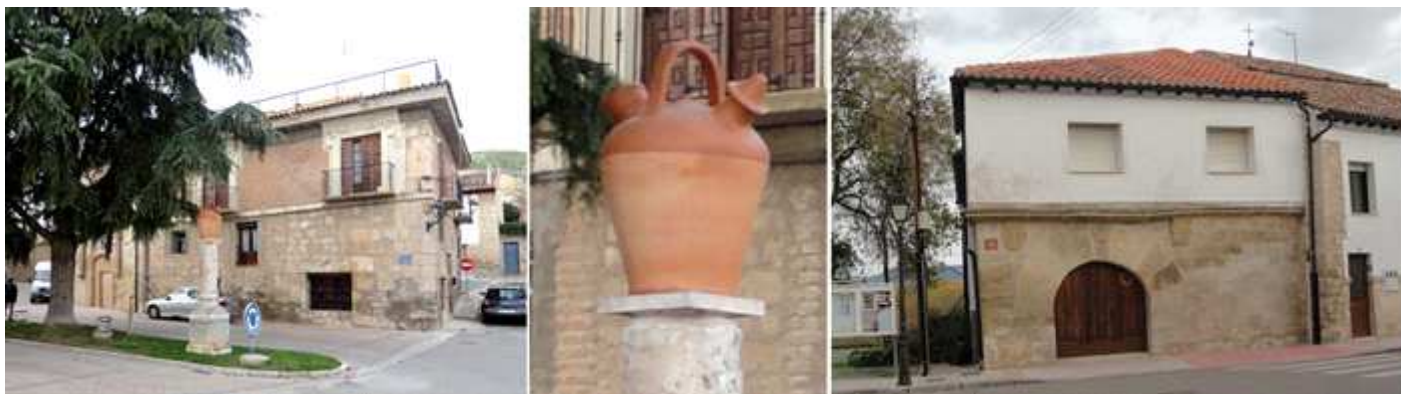
❶ Plaza de la Paz. ❷ Con el monumento al Botijero ausente. ❸ Casona con dos escudos nobiliarios en la Calle Corporación, (Calzada Bieja) contigua a la Plaza Dr. Sinova.