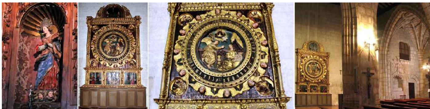
❶ En la hornacina central del retablo plateresco Mayor con la Virgen. ❷ Retablo de la Anunciación de 1ª mitad del S. XVI ❸ Detalle del este retablo renacentista castellano con pinturas de Antonio Vázquez y relieves estilo de Berruguete, rodeado de los ángeles y con las figuras del tetramorfos y coronado con un pequeño ático. ❹ Lateral de la nave del Evangelio.

Este templo posee dos naves de tres tramos separadas por arcos apuntados con artesonado de madera a dos aguas y desarrollando bóveda de crucería en su cabeceras.