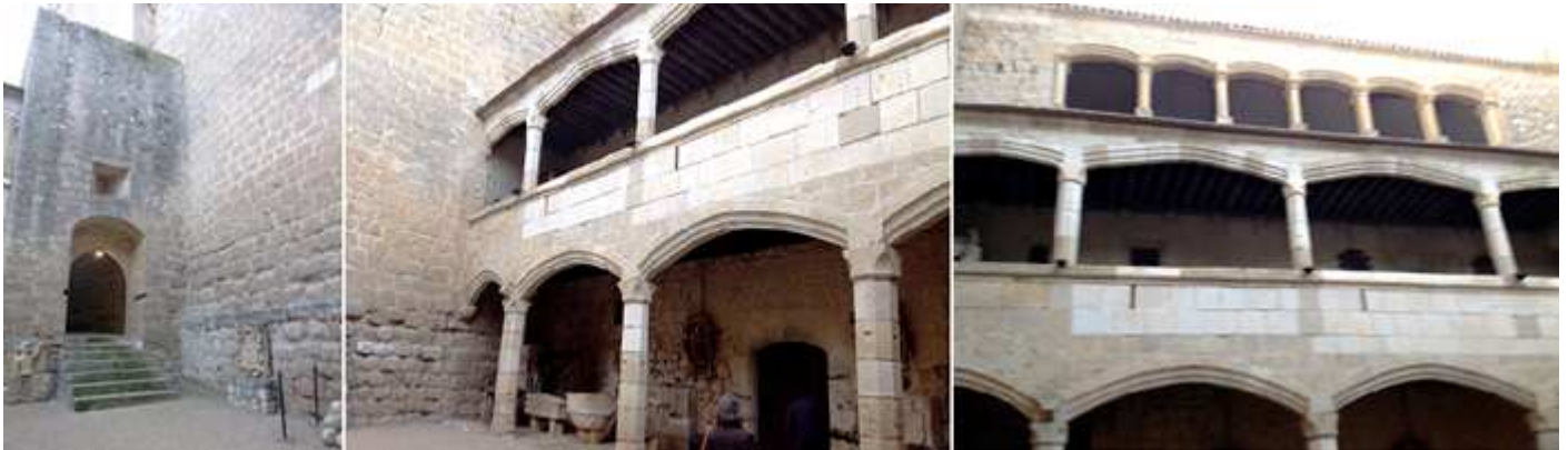
❶ Pared frontal de patio de Armas con uno de los accesos a su izquierda que en parte baja están las mazmorras. ❷ Detalle de sus galerías. ❸ Que dispone de tres plantas. La diferencia de tonos es por la restauración que se realizó en los años 60.

Su patio de Armas que dispone de laterales con galerías abiertas en tres lados con arcos escarzanos.