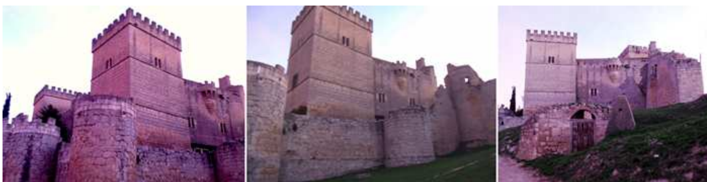
❶ La zona sureste del castillo con dos torres, con ventanas geminadas. ❷ Donde destacan sus grandes torres cuadradas de las cuatro que poseía en sus ángulos solo se conservan dos. ❸ Panorámica culminado su construcción sobre la loma.