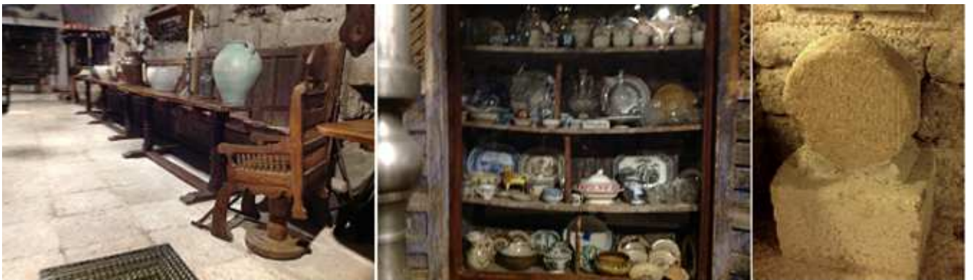
❹ Mobiliario y objetos variados. ❺ Estantería con cerámica y porcelana decorada. ❻ Estela discoidal con una inscripción en su interior está fragmentada y no posee vástago.