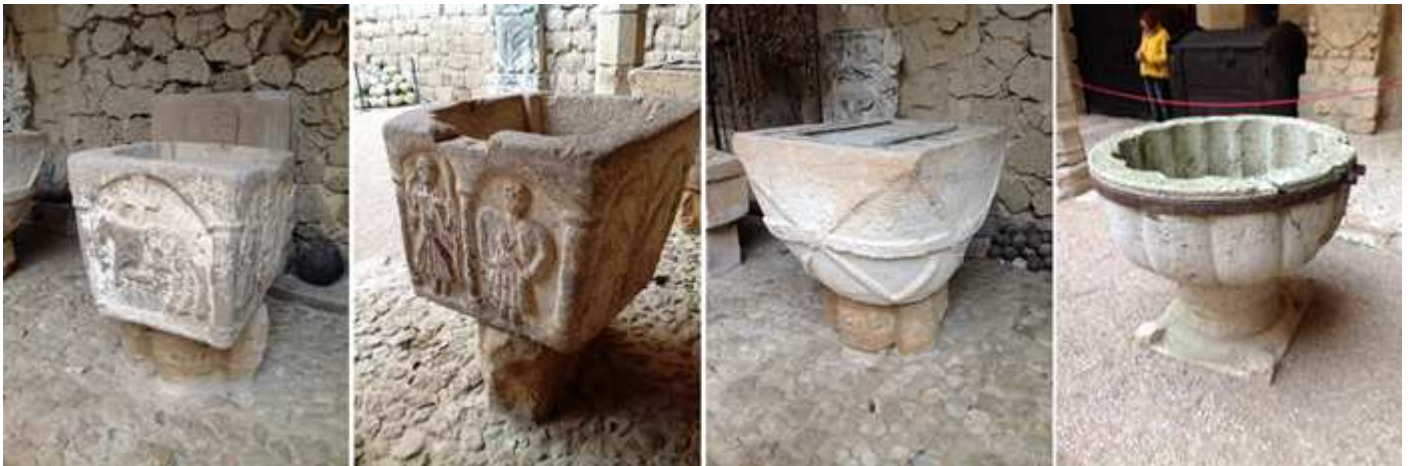
❶ Pila bautismal de piedra arenisca de taza cuadrada que en sus caras presenta uno o dos arcos con representaciones de animales y personas, no posee basa esta sobre un resto arquitectónico. ❷ Otras dos caras de esta pila. ❸ Pila bautismal de piedra arenisca de sección cuadrada superior pasa a troncocónica con unos boceles cruzados y uno más grueso horizontal, no posee basa esta sobre una pieza arquitectónica, situada en la Plaza de Armas. ❹ Pila de piedra con gran taza semicircular con su exterior con anchos gallones en relieve y en el interior más pequeños y profundos sobre un corto fuste y descansa en una basa cuadrada con resaltes en sus ángulos, situada en la Plaza de Armas. Esta fragmentada y tiene una grapa horizontal.

La colección que posee se encuentra repartida en seis sectores: Arte Sacro, Farmacia, Arqueología, Juguetes, Etnografía y Artes Populares, Sala de Armas y el Patio de Armas que visitamos.