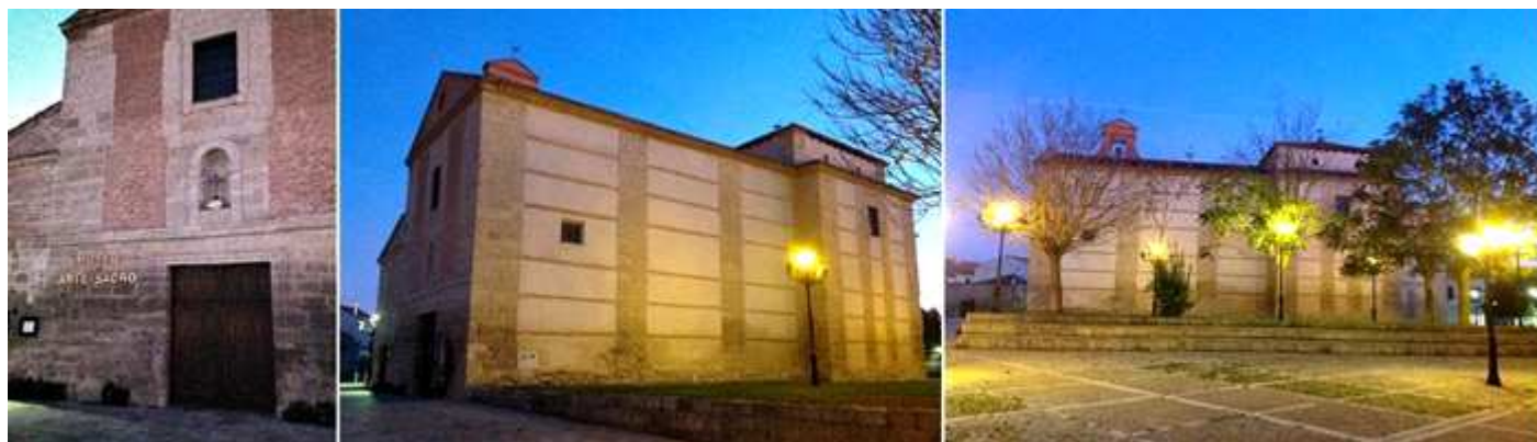
❶ Fachada con una puerta adintelada sobre la misma posee una hornacina con una cruz. ❷ Lateral exterior del lado epistolar. ❸ Construida en piedra, con hiladas de ladrillos entre sus paños. Sobre la misma corona una espadaña de un solo vano. Imagen de parte de la plaza de San Miguel.

En lo que fue el antiguo convento de San Francisco que fuera fundado en el S. XVII por el Duque de Lerma, queda su iglesia en la que se ubica sus instalaciones.