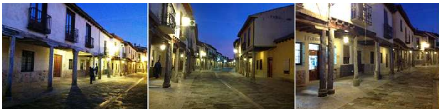
❶ Los soportales mayormente con techumbre entramada de madera. ❷ Y sustentada por zapatas, columnas de piedra o madera y basas de piedra. ❸ Son edificaciones de dos alturas, de construcción sencilla con entramos y muros de adobe.

Nombres de calles como la del Agua... Corredera...o actividades como Yeseros... Candeleros...Plaza del Tinter, etc..