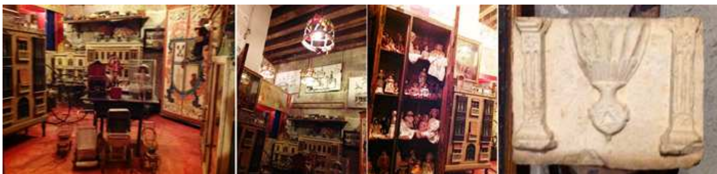
❶ Sala de Juguetes y autómatas. ❷ Casitas de muñecas. ❸ Y una colección de muñecas de porcelana. ❹ Pila realizada en un bloque de piedra rectangular que en su frontal tiene una par de columnillas estriadas y en el centro el volumen de la taza con gallones excavados troncocónica y que en su base termina en un medallón que posee una estrella de seis puntas.

La colección continúa en la Torre del Homenaje con otras salas para los recorridos “Secretos” con grupos muy reducidos siguiendo después en otras dependencias y salones.