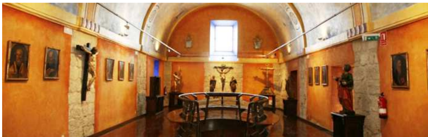
❶ Foto interior del templo con bóveda de cañón.

La iglesia con estilo del renacimiento tardío y posee decoración mudéjar, en el se exhiben las piezas del patrimonio que son numerosas de los S. XII al S. XVIII. Tanto de pintura, escultura y piezas de orfebrería.