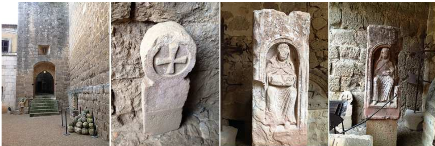
1 Uno de los accesos de la plaza de Armas a la Torre del Homenaje. 2 Estela discoidal con un grueso aro fragmentado y dentro una cruz patada con gran relieve con un vástago rectangular. 3 Fragmento arquitectónico, de una columna ¿? Que en esta cara tiene una hornacina con una monja leyendo. 4 Otra vista de otra cara de la misma columna.

Además de las Piñas bautismales, se encuentran escudos nobiliarios y piezas funerarias como sepulcros y estelas, junto con miliarios de época romana.