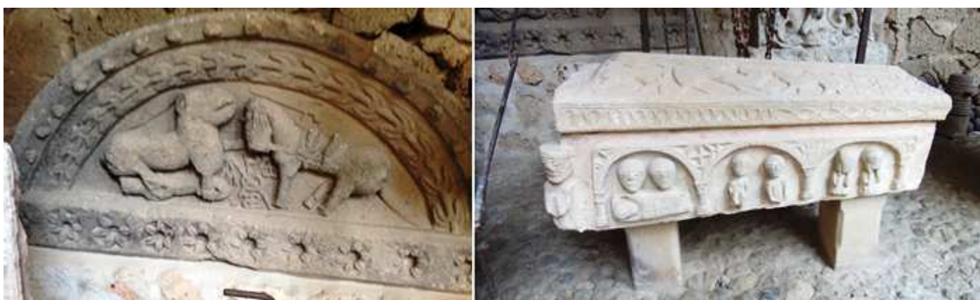
1 Tímpano de la puerta de la torre perteneciente a la iglesia románica de San Julián, de Santa Cruz de Mena. S. XII. Rodeado con un guardapolvo con bolas (o puntas de diamante ¿?) y un arco con un tallo de hojas dobles sobre la escena interior de un león que abre su fauces enseñando los dientes, con el jinete hollado a sus pies y frente a él, un caballo con bridas y ensillado con una espada encima del caballo. en el espacio entre los animales un crismón de seis brazos con A a Alfa, y \Omega \omega Omega pinjantes de los cruzados, la P sobre el superior y la S enroscada e invertida del inferior con un círculo en el cruce de los brazos, sobre el dintel con diez flores hexapétalas. 2 Sepulcro con tapa que posee tres animales una estrella de ocho puntas y una rosácea de seis pétalos, en su frontal, el posible finado y tres arcos con escenas de velando al difunto, dos personas desnudas masculinas, y dos femeninas posibles lloronas. (No he conseguido saber su procedencia).