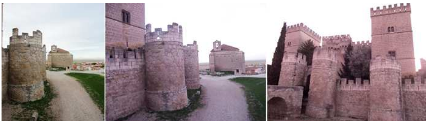
❶ Uno de los cubos exteriores. ❷ Con lienzos de barbacanas se saltean su torres, al fondo la ermita de Santiago. ❸ Vista frontal, tras el puente disponía otro levadizo.