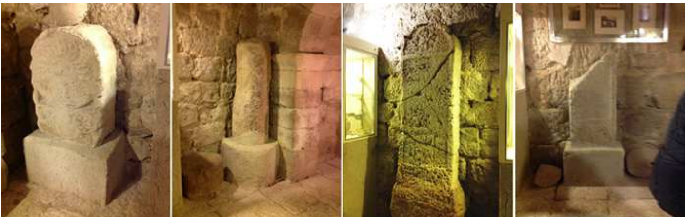
❶ Estela discoidal con un disco solar con radios dextrógiros, bajo el disco su vástago recto muy corto (posible fragmentado) en su frontal, a los lados dos rosáceas de seis pétalos. ❷ Miliario de calzadas romanas. ❸ Estela de gran tamaño fragmentada en el arco superior dispone de una rosácea de seis pétalos, y en el espacio central una inscripción muy deteriorada, parece ser piedra ostionera. ❹ Estela con su parte superior fragmentada con una inscripción orlada con un cordón en su parte central y en la inferior, dos arquillos de medio punto.

La cocina del castillo está dedicada a la Etnografía y artes populares con lo referente a la vida cotidiana del campo.