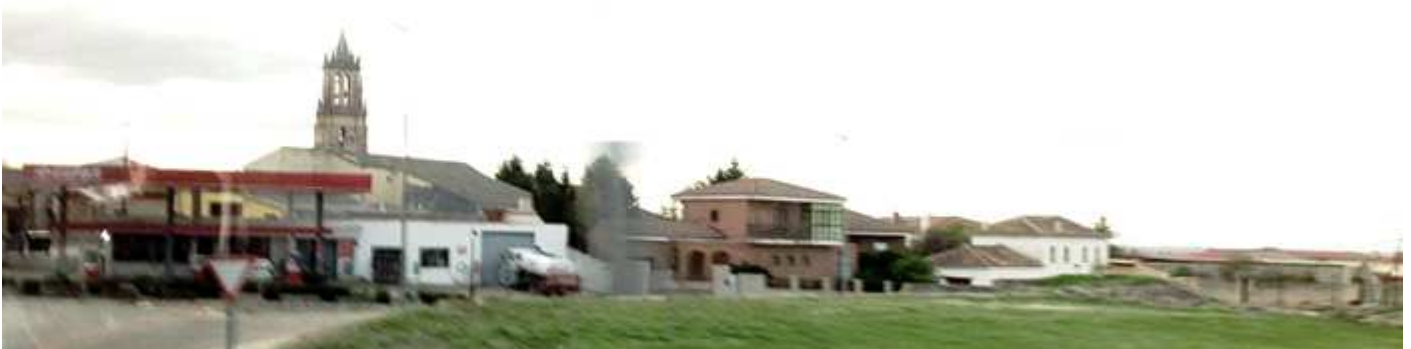
📍 Panorámica a la entrada de la Villa.

Localidad que pertenece a la comarca de Tierra de Campos. Debió de fundarse con la ocupación romana hacia el S. II ó I a.C. cuando la poblaron tras la campaña con los Vaceos. Es una villa muy antigua que llegó a tener sede episcopal.