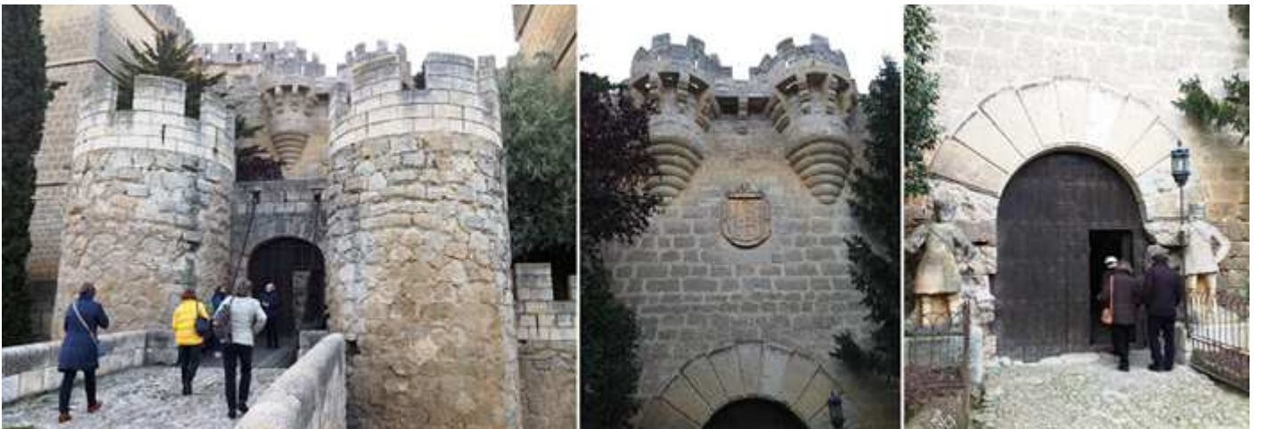
❶ Puente de piedra elevado con una rampa en forma de L. Entramos con un grupo. ❷ Sobre la puerta dos matacanes redondos. Y el escudo del Duque de Lerma. ❸ Y esta está construida con grandes dovelas lisas, y custodiada a los lados con dos guerreros de piedra.