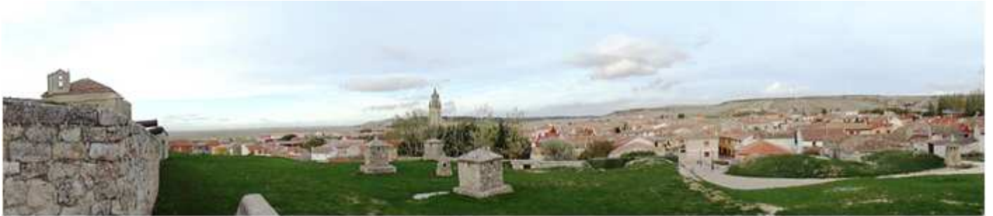
❶ Una bella perspectiva del horizonte, y ante el castillo las bodegas y chozos.