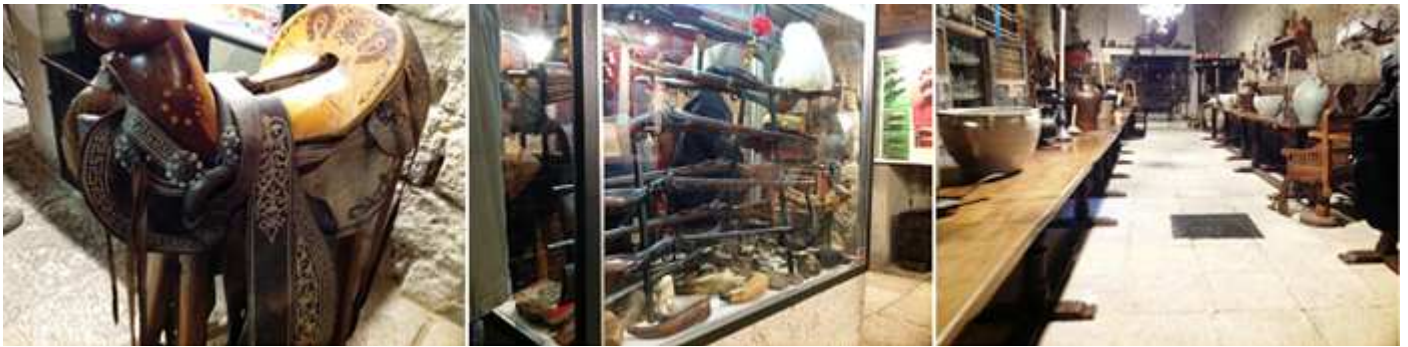
❶ Otra silla de montar con labores de repujado mejicana. ❷ Vitrina con fusiles y escopetas. ❸ Sala con objetos etnográficos muy variados.