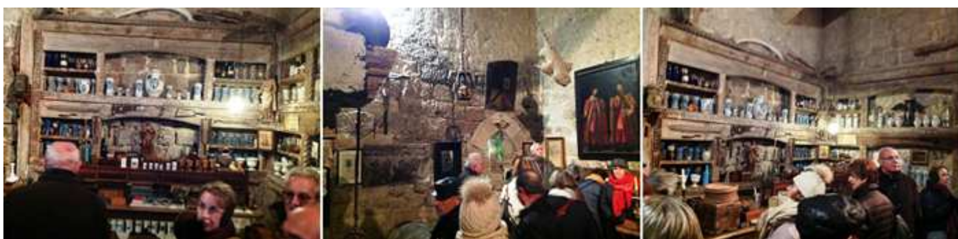
❶ La sala de la botica, con albarellos de Talavera de la Reina. ❷ Con todo tipo de objetos de farmacia y otros. ❸ Y una variada colección de botes de farmacia en cristal y cerámica. En esta sala tiene colgada la piel de una anaconda de 5m.