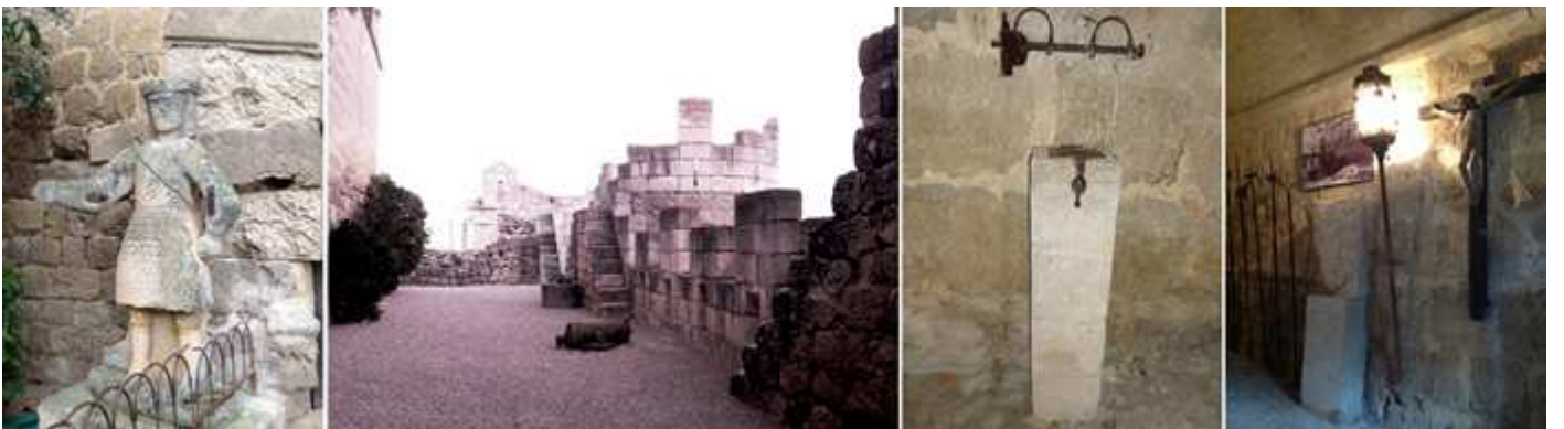
❶ El que está situado a la izquierda. ❷ Perímetro interior entre esta línea de almenas y torreones y el propio castillo. ❸ Una ara romana ¿? convertida en limosnero. ❹ A los lados del portón de entrada toda clase de objetos y entre ellos un Santo Cristo.

Y entramos a su interior por un puente construido en 1538 que salvaba el foso que lo rodeaba. Y tras el puente el espacio levadizo ante su puerta. Le sigue un espacio que lo rodea con una barbacana almenada.