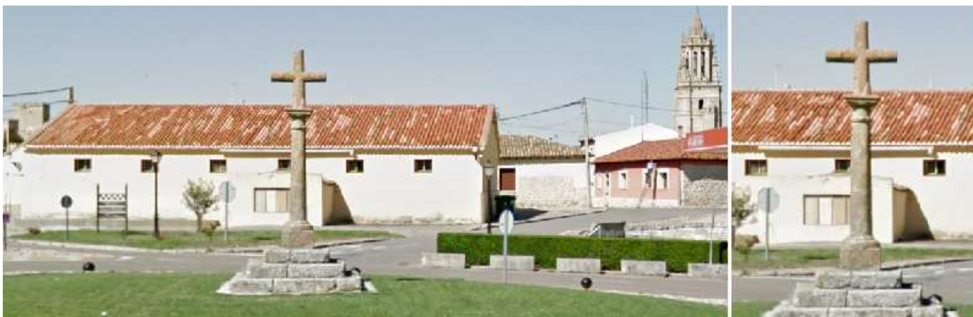
❶ Crucero en la rotonda donde confluye la P-904 con la P-901. ❷ Crucero sobre un estrado de escalones con una columna redonda y una cruz desnuda con brazos iguales (griega).

Antes de la invasión musulmana era una localidad pujante, las los árabes en la reconquista fue repoblada. En el S. XV paso al poder feudal de Pedro García de Herrera que fue Mariscal de Castilla.