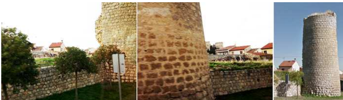
❶ Cubo de la muralla en la carretera que va a Vitoria de Alcor. ❷ Su parte baja empleada como tapial. ❸ Uno de los cubos que permanecen de ella.

Se conservan sus ruinas consolidadas en algunos tramos con algunos cubos aislados de gran altura. Conto la villa con un primer recinto a finales del S. XIII de la Cerca Vieja o Alcerca, como se la conocía. Y esta fue ampliada con la Cerca Nueva.