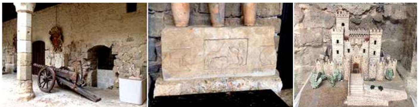
❶ Planta baja de una de las galerías con este cañón. ❷ Frontis labrado de 1664 con varias figuras. ❸ Maqueta del castillo en la recepción.

La colección que posee se encuentra repartida en seis sectores: Arte Sacro, Farmacia, Arqueología, Juguetes, Etnografía y Artes Populares, Sala de Armas y el Patio de Armas que visitamos.