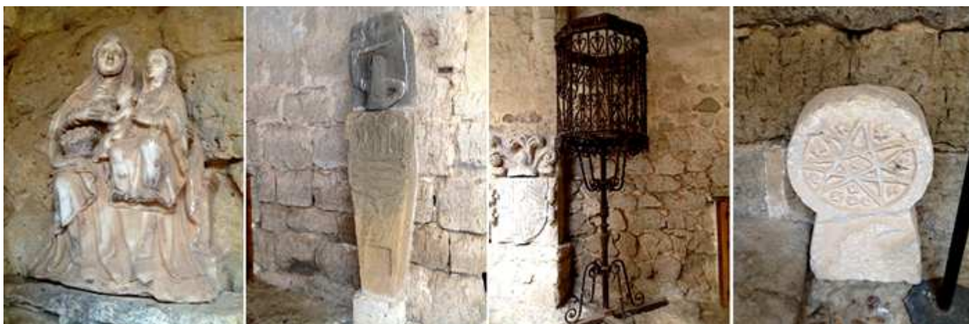
1 La Virgen con el Niño con Santa Ana ¿?. 2 Estela con un escudo ¿? Y un fragmento de un guerrero sobre la misma. 3 Púlpito de forja. 4 Estela discoidal con un aro y dentro una estrella en perfil cruzado de siete puntas en relieve, en sus espacios libres clavos de distinto tamaño con un vástago corto y acampanado.

La mayoría de piezas expuestas proceden de las localidades de la provincia de Palencia.