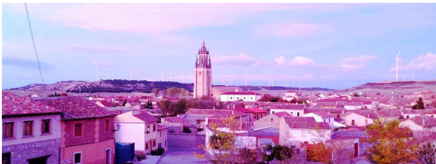
❶ Vista del caserío desde el castillo.

En las proximidades del castillo existió el barrio judío de la localidad con un entramado de calles estrechas.