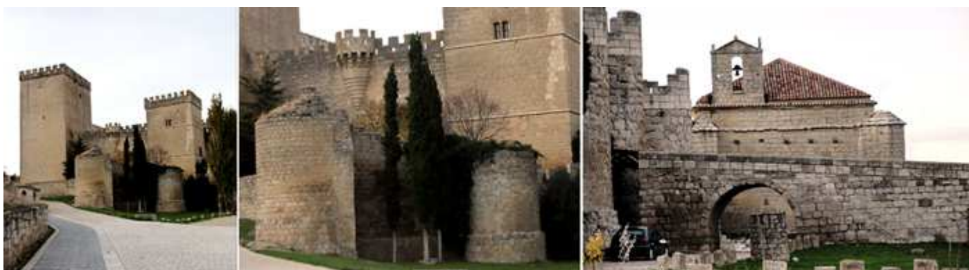
❶ A la izquierda la Torre del Homenaje que posee varios pisos, con bóvedas de crucería y escalera de mármol embebida en sus muros. ❷ Dos de los cubos cilíndricos que rodeaban con sus murallas el castillo. ❸ Un tramo de la rampa con puente para acceder a su puerta. Que fue construido en 1538.

Está circunvalado por muros de barbacana con torres cilíndricas, y tiene una planta trapezoidal, ante su puerta el puente levadizo sobre el foso, con un patio interior y al suroeste tiene la Torre del Homenaje que alcanza hasta sus almenas 30m de altura.