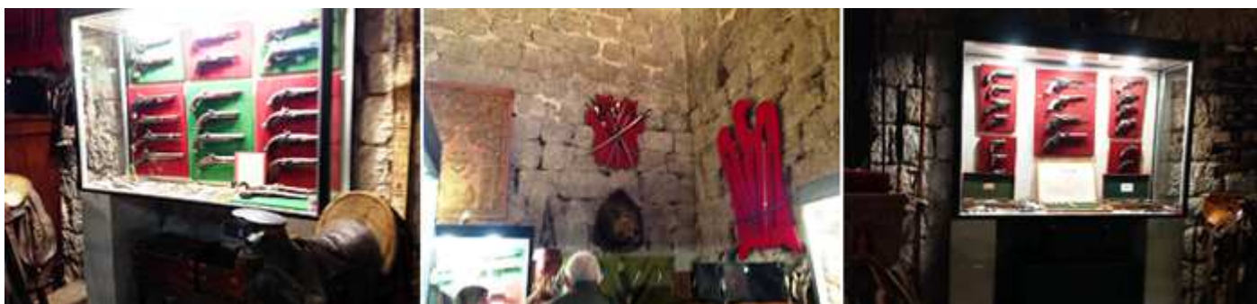
❶ Vitrina con dieciséis tipos de pistolas. ❷ En esta sala de armas en panoplias distintos juegos de espadas, armas blancas. ❸ Otra vitrina con pistolas. Posee una con cuatro cañones. Esta sala también tiene instrumentos musicales.

En la farmacia se recrea una de la época, que dispone de una silla de amputaciones.