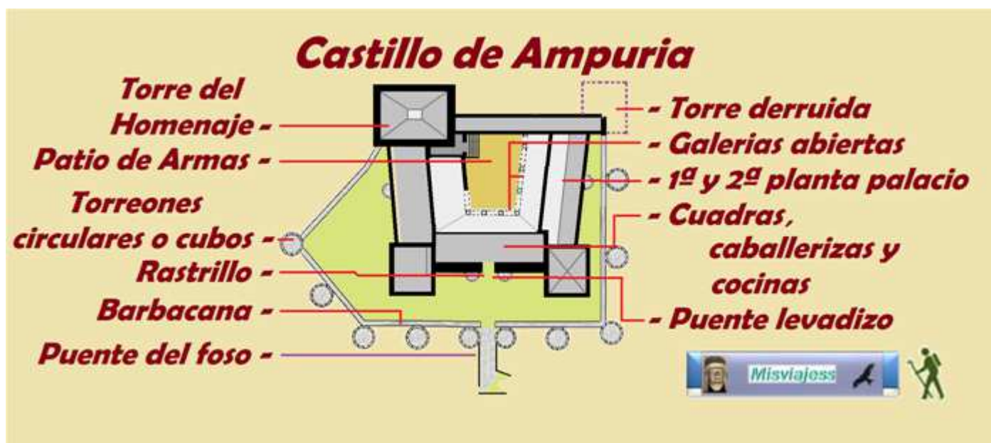
❶ Croquis del castillo, realización propia.

La colección continúa en la Torre del Homenaje con otras salas para los recorridos “Secretos” con grupos muy reducidos siguiendo después en otras dependencias y salones.