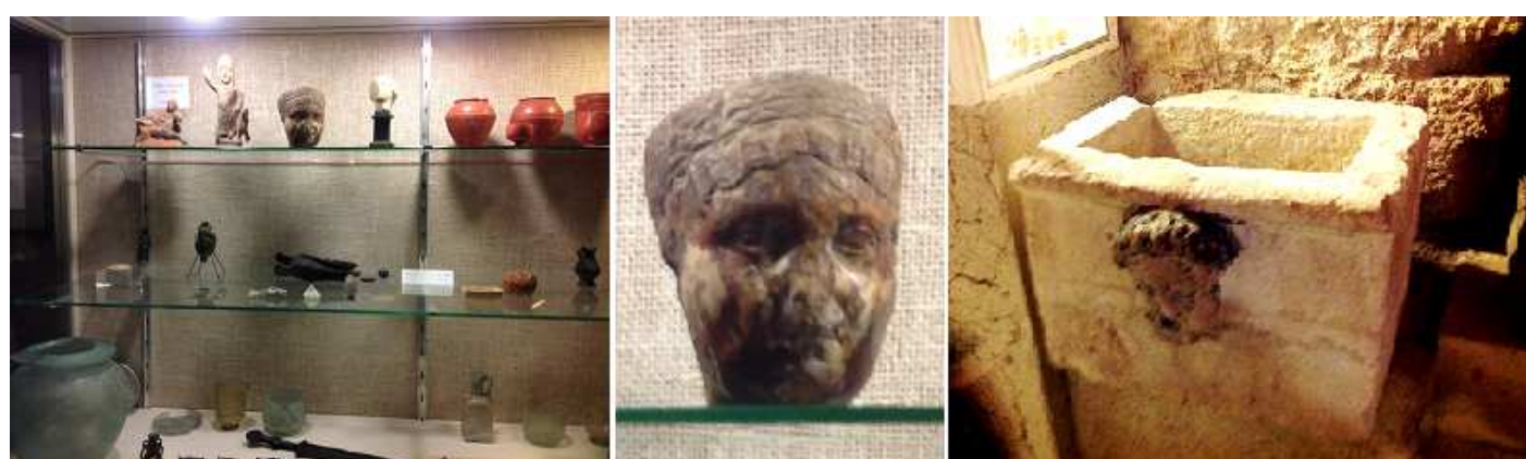
❶ Antigua Colección de Simón Nieto. Con objetos de la necrópolis de Palencia. Y que se relacionan con los ritos funerarios. En el ángulo superior izquierdo hay un grupo de divinidades romanas. Esta vitrina como otra que hay de la colección Monteverde se compraron para integrarse con objetos romanos, visigodos, etc. ❷ Una cabeza de esta colección. ❸ Pila romana ¿?