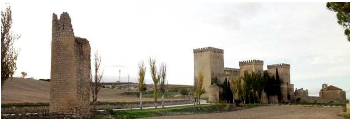
❹ Otro de los cubos aislado a la entrada que lleva al castillo.

Durante la Guerra de las Comunidades se asalto la villa, por lo que fue destruida ambas cercas. Esta disponía de seis puertas de acceso. Lo primero que hacemos fue visitar el castillo, por las horas de visita que tiene y que organiza mediante grupos.