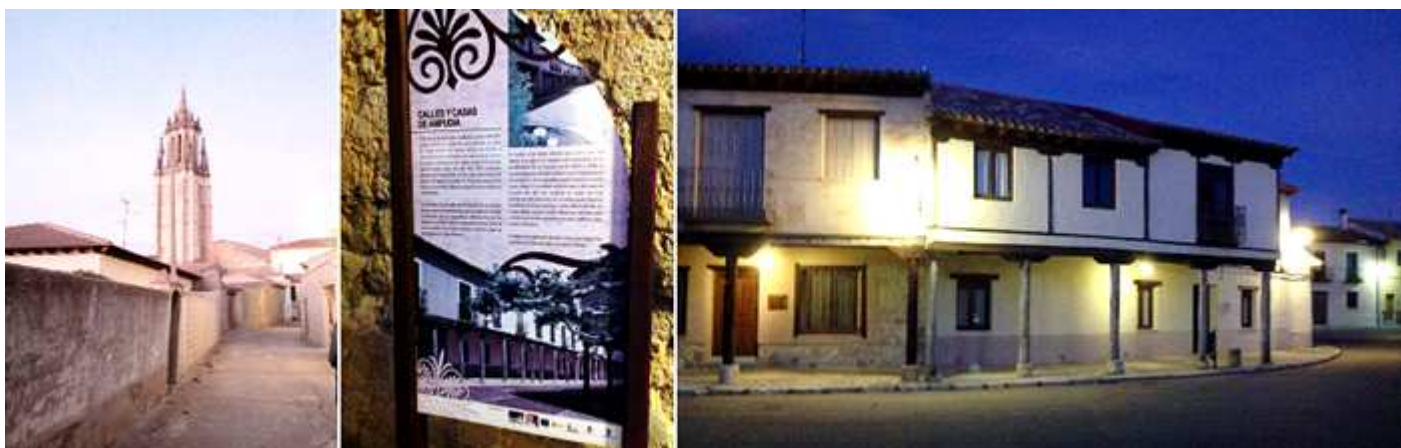
❶ Recorrido por su entramado urbano. ❷ Información de las calles con soportales. ❸ son construcciones de dos plantas con la parte inferior abierta con columnas de madera o piedra con basas y zapatas.

Los nombres de sus calles tienen relación con los oficios que se generaban en ellas o de los ilustres habitantes de la villa.