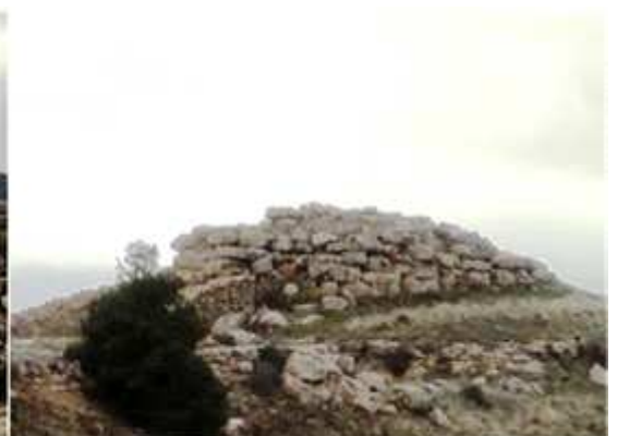
① Situado muy cerca del precipicio, y a la altura del “Aguallueve” ② Sobre una base que se encuentran algunos sillares, y los restos de sus muros. Que es una construcción de piedra seca con bloques megalíticos. Tiene forma de planta cuadrangular