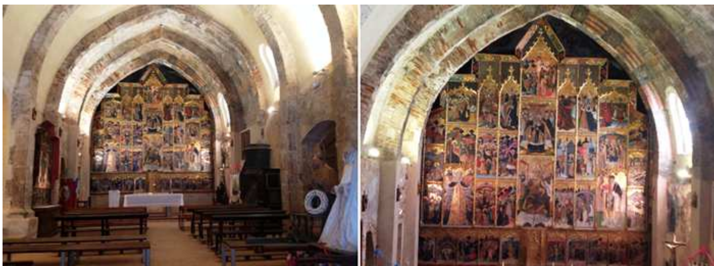
❶ Interior del templo. ❷ Y el gran retablo de Blasco de Grañén (maestro de Lanaja) que se compone de 37 tablas, es la joya más preciada del gótico aragonés del S. XIV (1459). Con una importante calidad pictórica y riqueza iconográfica. Mide 7 de alto por 6,80

Su interior de nave única rectangular con nueve tramos con arcos fajones que soportan su bóveda de cañón apuntado.