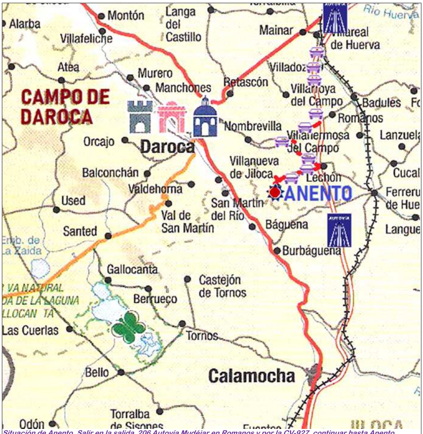
Situación de Anento. Salir en la salida 206 Autovía Mudéjar en Romanos y por la CV-927, continuar hasta Anento.

ANENTO Iglesia de San Blas, Ermita de Santa Bárbara, Castillo, Merendero, “Aguallueve”, Torreón de San Cristóbal y Mirador.