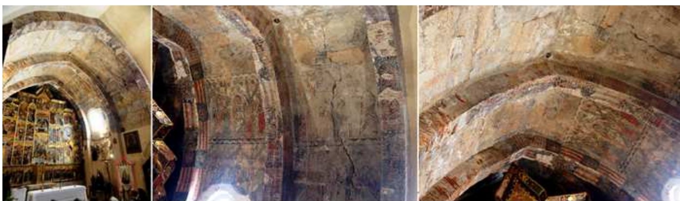
1 Cabecera con los dos tramos de la nave donde mejor están las pinturas. 2 Pinturas que han perdido su tonalidad cromática. Pero las del otro lado por los efectos del sol sus rasgos son menos perceptibles. 3 Los arcos fajones que la pérdida de la policromía y yeso dejan ver el empleo de los ladrillos para la realización de los mismo.