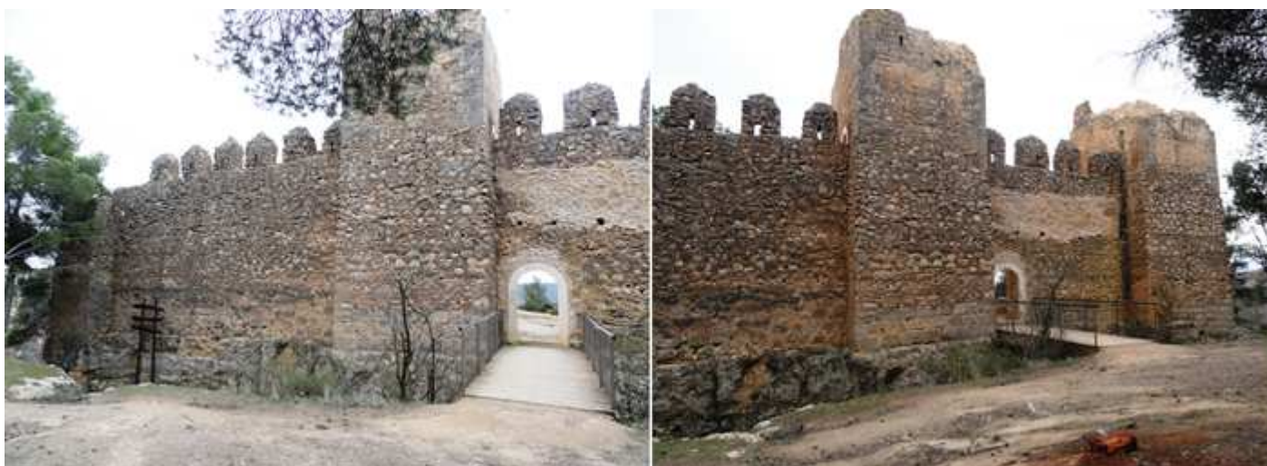
❹ Su puerta de medio punto, ante un foso cortado en la roca. ❺ Con una construcción mayormente de cantería.