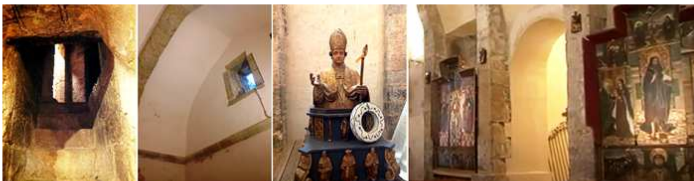
❶ Aspilleras en la escalera de subida a la torre. ❷ La bóveda de cañón apuntado de la sacristía que esta a continuación de la escalera del campanario. ❸ San Blas. ❹ Lateral del Evangelio desde el altar con la capilla de baptisterio o del Santo Cristo.