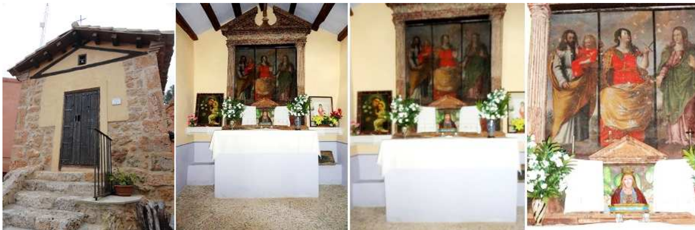
❶ Su portada sobre elevada con un estrado de escalones. ❷ Interior de la nave. ❸ A la izquierda del retablo un San Antonio de Padua. ❹ El retablo de su cabecera con tres calles pintadas con San José Con el Niño a la izquierda, Santa Bárbara en el Centro que porta un espada en alto, y la Virgen María a la derecha.

En frente de la ermita se encuentra el Mirador de Santa Bárbara.