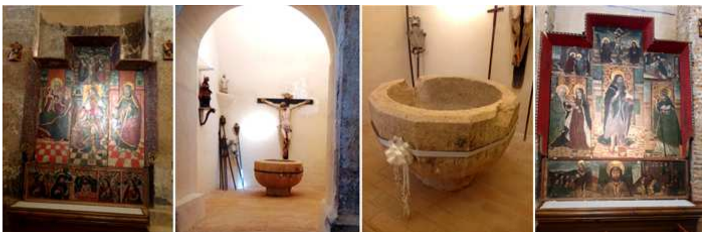
❶ x. ❷ Capilla del baptisterio. ❸ Pila bautismal de piedra troncocónica con 10 facetas lisas, sin fuste que terminan en una basa redonda, está alojada en la capilla que hay en el lateral del Evangelio. La pila es la original del templo. ❹ Retablo dedicado a San Juan Bautista., con el abrazo de la Virgen a Santa Ana (izdª.) Misa de San Gregorio (dchª.) y un Calvario.

Todo el templo debió de tener sus muros pintados, con un estilo del gótico lineal, y que solo se han conservado los frescos en los tramos de la cabecera.