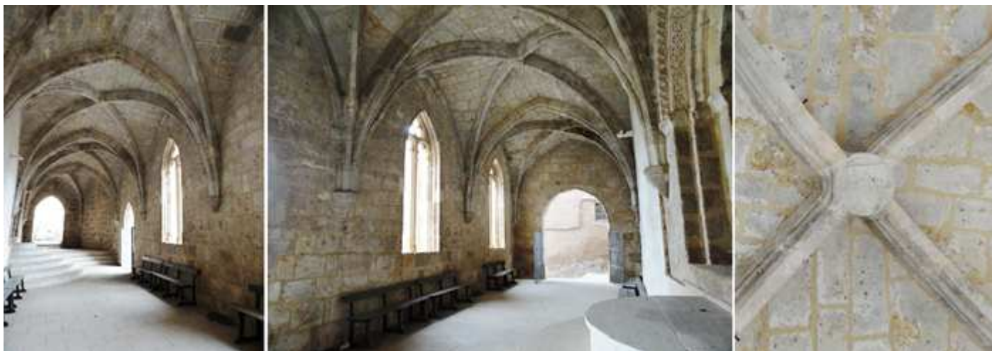
❶ En el tercer tramo dispone de una puerta a las escaleras que bajan a la calle inferior. ❷ Al fondo la puerta del primer tramo. ❸ detalle de una de las claves con el escudo con los cuatro palos (barras) de la Corona de Aragón.

Su pórtico de estilo gótico compuesto por cuatro tramos con crucería simple y arcos apuntados, en cuyas bóvedas sus claves ostentan el escudo de la Corona de Aragón.