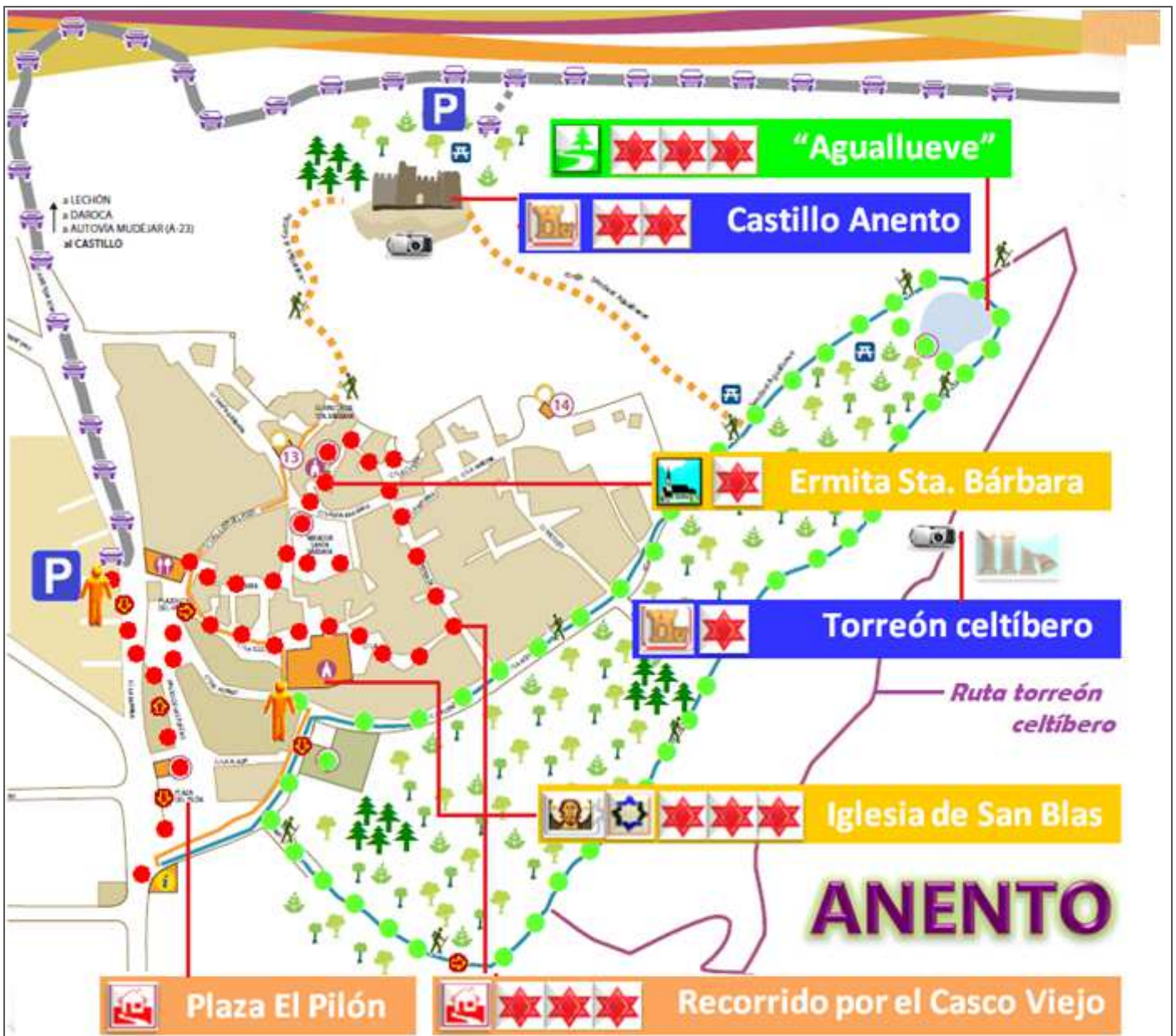
Croquis itinerario visitas, plano empleado el que entregan en la Oficina de Turismo local.