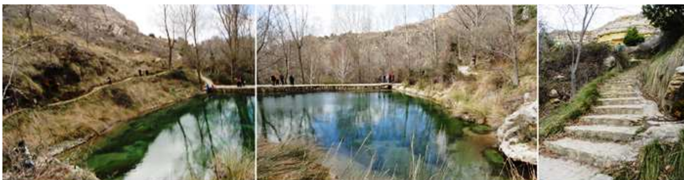
❺ Vista desde la parte opuesta del estanque. ❻ Y tomamos de vuelta el camino. ❼ Con estas escaleras que hay a mano derecha.

Lo ideal de la vista como suelen recomendar es tomar el camino que va por la derecha, y volver por el otro que discurre por la parte izquierda y que lleva al Merendero.