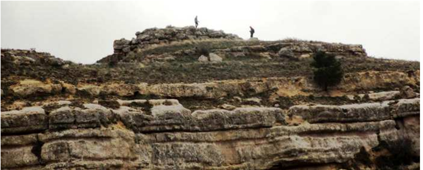
📍 Otra instantánea tomada desde el castillo.

Probablemente date sobre los 200 a.C. Los Celtíberos vivían en distintos tipos de asentamientos, que las fuentes antiguas denominan poleis o urbes, civitates, vici y castella que eran los asentamientos menores y por los historiadores creen que eran de estos. Anento fue con casi toda probabilidad territorio de los belos .