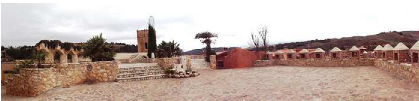
❶ El mirador. Es una lástima el día, pues aunque no hace frío, está efectuando muchos cambios y no hay muchos momentos soleados.

En frente de la ermita se encuentra el Mirador de Santa Bárbara.