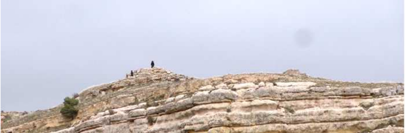
📍 El torreón visto desde el merendero.

Esta en un lugar estratégico, idóneo para hacer una excursión a pie y en el que suelen ver algunos excursionistas.