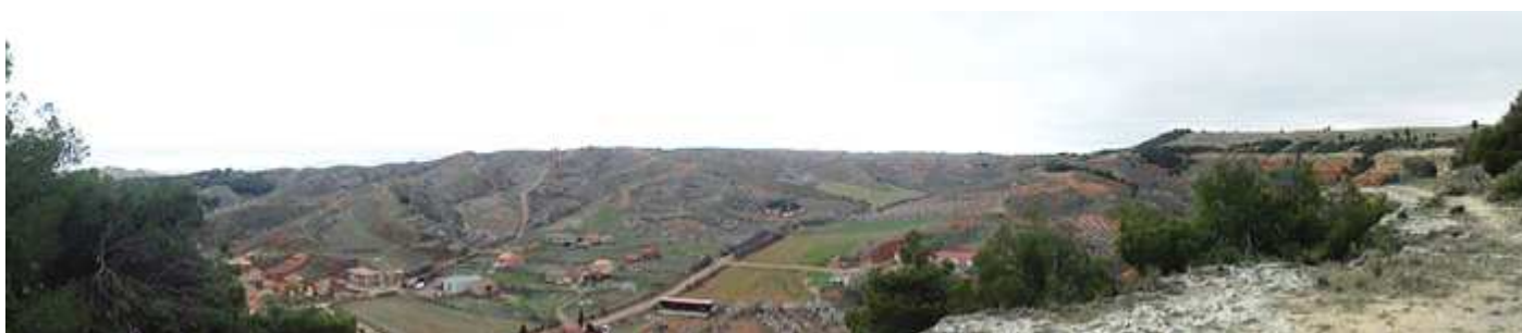
❻ Perspectiva desde la esquina derecha del castillo, sin haber entrado, desde la zona del pinar en la que mantiene un cortado, al igual que en la parte opuesta.