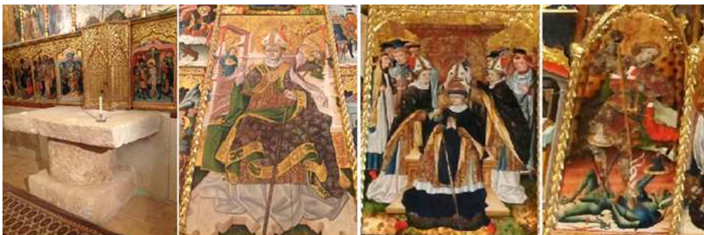
1 Ara del Altar y el Sagrario de los años 30 del S. XV. Esta ara es la original del templo. 2 San Blas entronizado. 3 San Blas, consagración como obispo. 4 San Miguel lanceando al dragón (el mal).