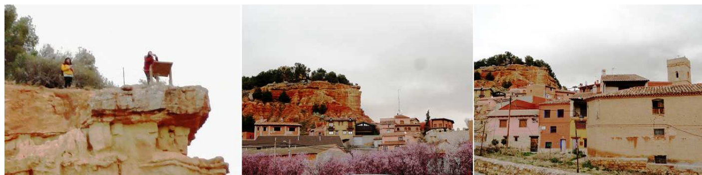
4 El mirador del castillo. 5 Asentado sobre un tozal (cima de un cerro o collado). 6 Y entramos en la localidad.

Nada más llegar y aparcar en el aparcamiento (amplio) que ha puesto el Ayuntamiento, como la persona que nos recomendó la visita nos avisó de que pasáramos lo primero a la Oficina de Turismo, para sacar la entrada de la visita del templo...y de la ficha del aparcamiento que suministra el expendedor que hay junto a su entrada.