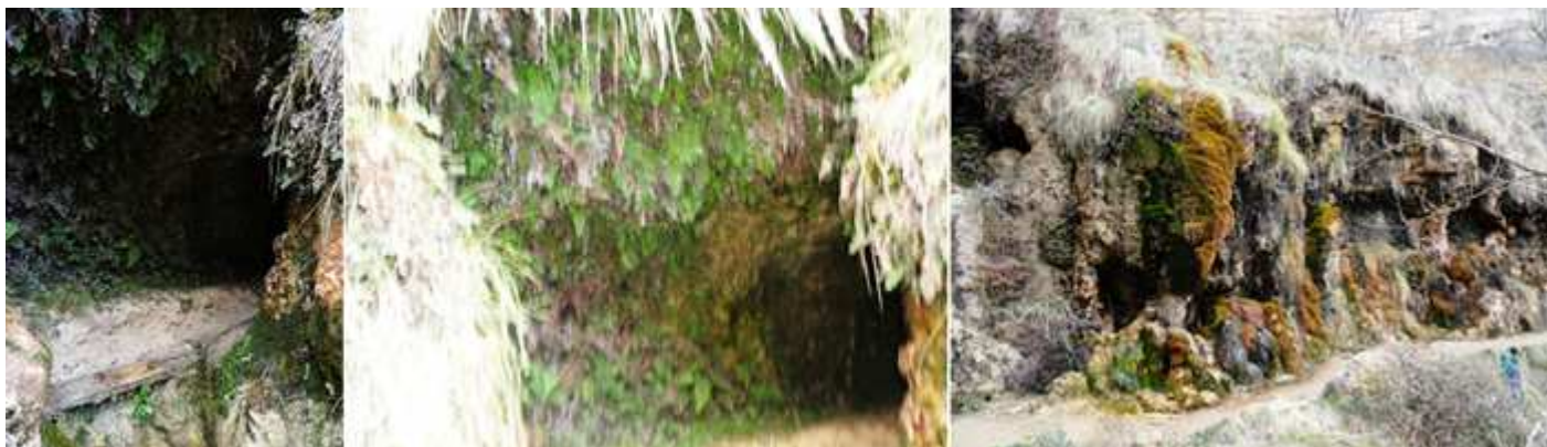
❷ Entrada a otra cueva. ❸ Con un pequeño pasadizo, que también cae agua por su interior. ❹ Y que tiene unos vanos entre la vegetación a modo de ventanas.

Lo ideal de la vista como suelen recomendar es tomar el camino que va por la derecha, y volver por el otro que discurre por la parte izquierda y que lleva al Merendero.