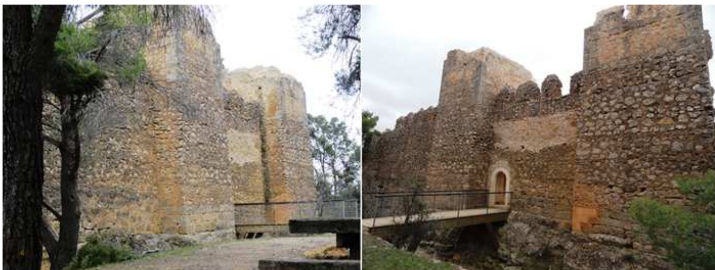
❼ Los paños de sus murallas en el lado oriental. ❽ Detalle del foso existente, ante esta parte del castillo que lo aislaba.