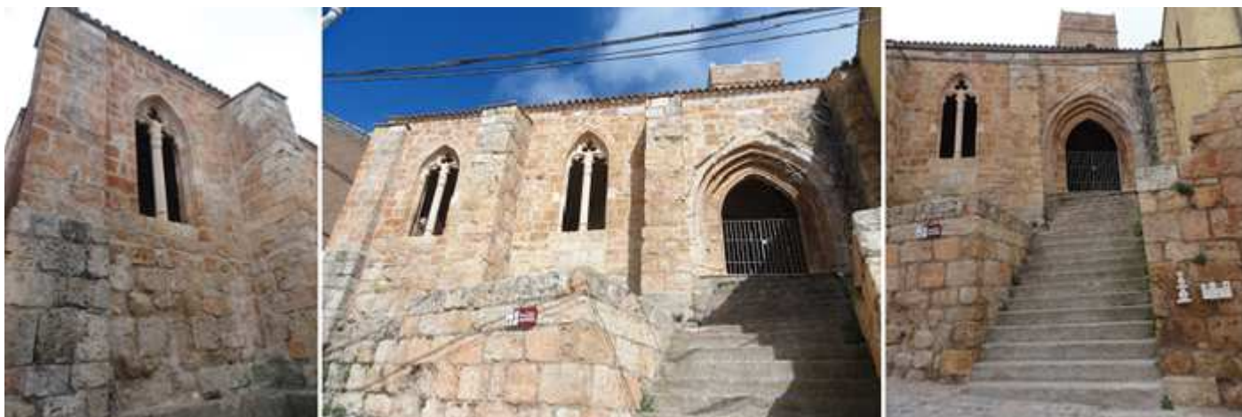
❶ Sus ventanas dobles alojadas en un arco apuntado. ❷ Fachada a la calle del Horno con gruesos contrafuertes y una puerta apuntada con cuatro arquivoltas baquetonadas, y cubierta con un guardapolvo en ángulo recto. Y su alero es liso. ❸ Este lado posee una gran escalita para compensar el gran desnivel de la plataforma del templo con la calle.

Completamos el exterior de la parte opuesta antes de entrar en el templo, donde se pueden apreciar algunos canecillos.