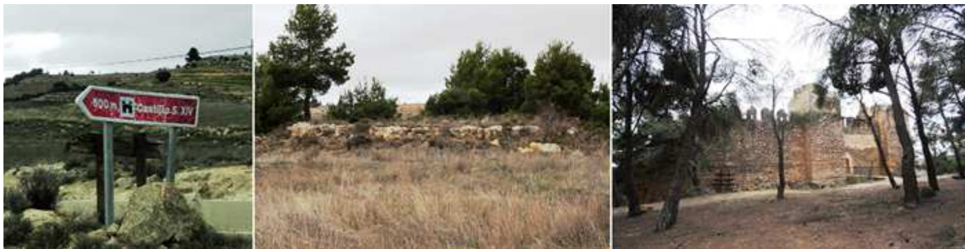
❶ Cartel indicador en el desvío. ❷ Restos de alguna construcción frente al aparcamiento. ❸ Y la fachada principal con tres cubos.