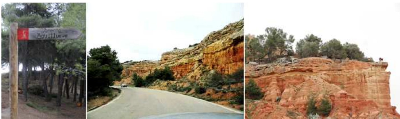
1 Junto a la caseta existente en lado izquierdo esta la senda que baja al merendero o al "Aguallueve". 2 Y bajamos a Anento. 3 Detalle del cortado que tiene el pario del castillo.

El castillo mantuvo actividad bélica por ser frontera con Castilla, y fue empeñado por 60.000 ducados por Pedro IV para poder financiar estas guerras con Castilla que fue tomado y recuperado en 1357. Volvió a los enfrentamientos cuando Álvaro de Luna ataca Aragón en el S. XV. Se encuentra en la Lista Roja.