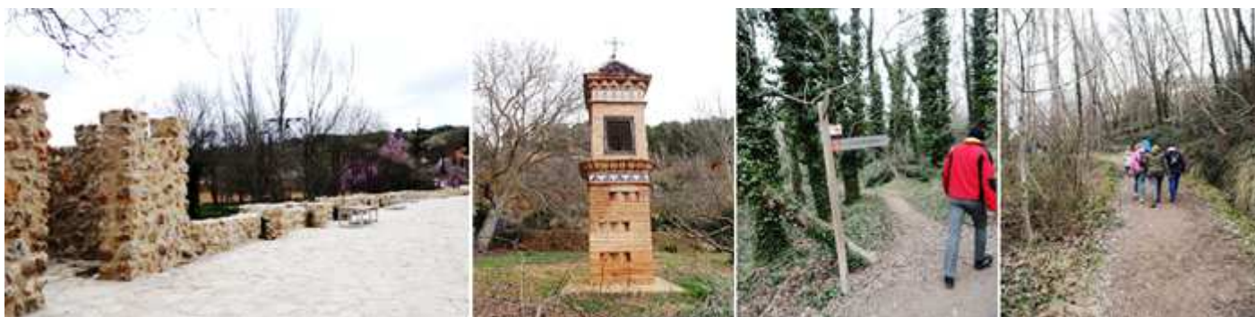
❶ Desde las escaleras de la iglesia en su lateral del pórtico, tomamos de frente hacia el peirón. ❷ Peirón de El Pilar. ❸ Y tomamos la senda que esta señalizada. ❹ Que entre chopos, olmos y a nuestra izquierda se ven las huertas...

Es una formación caliza donde varios manantiales afloran, creando un mural donde el agua va desprendiéndose con un goteo fino de donde proviene su apelativo de “aguallueve” en el lado derecho dispone de una oquedad a la que se puede acceder (si uno es atrevido y quiere mojarse) y que dispone de unos vanos.