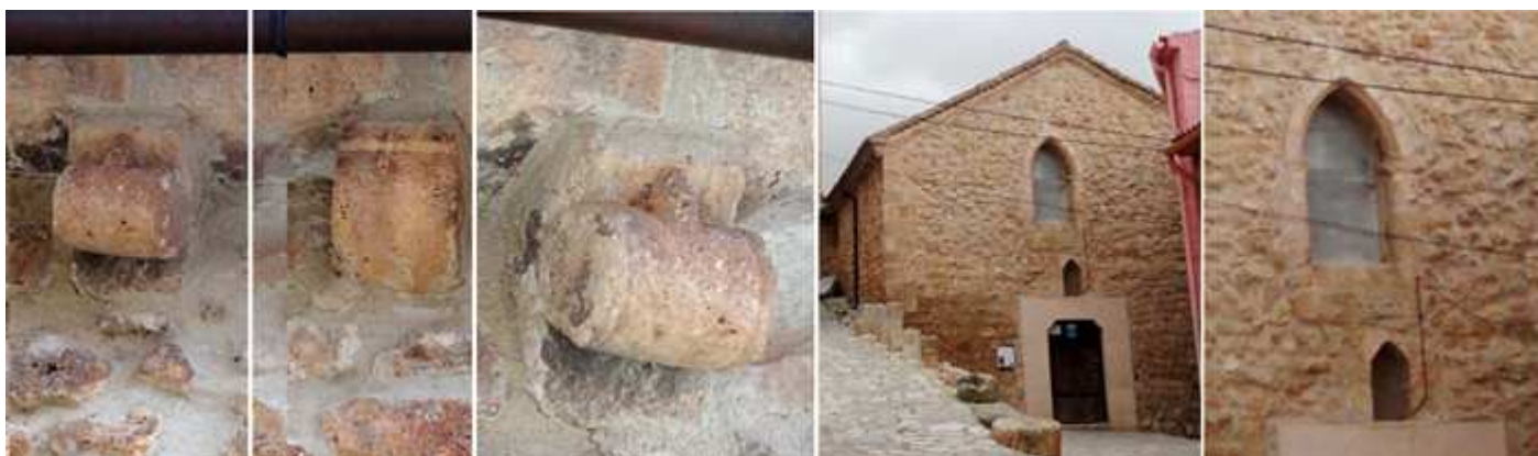
❶ Canecillo con un cilindro. ❷ Canecillo de nacela. ❸ Canecillo con un tonel. ❹ En e hastial una moderna puerta adintelada. ❺ Con una pequeña hornacina vacía y una ventana apuntada que ilumina el coro alto.

Completamos el exterior de la parte opuesta antes de entrar en el templo, donde se pueden apreciar algunos canecillos.