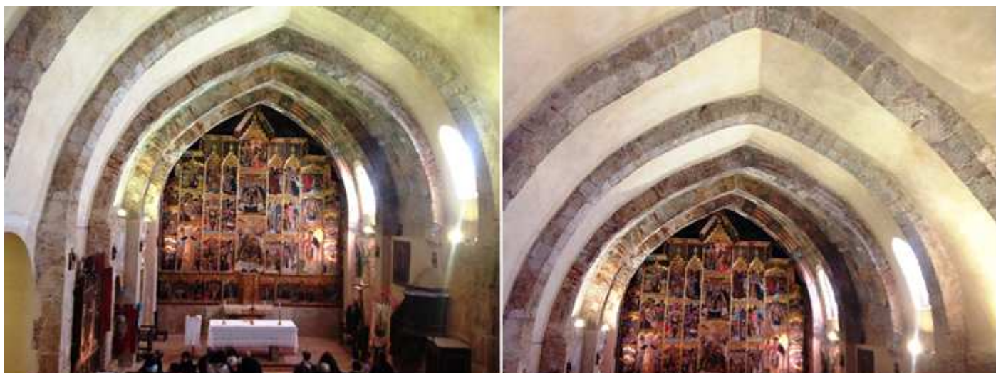
❹ Aspecto de sus arcos fajones apuntados. ❺ Curiosamente sobre la bóveda de la nave tiene la cubierta de teja árabe a dos aguas.