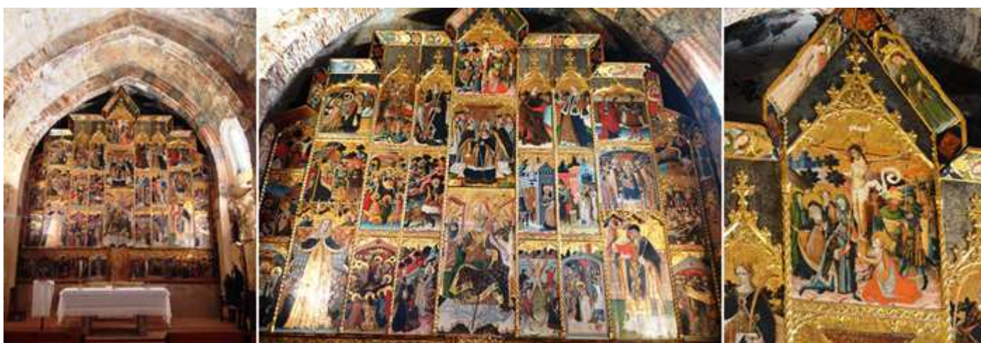
❶ Este es un retablo que se encuentra completo desde el día que se colocó para esta cabecera. ❷ El retablo se realizó entre 1422 y 1459. Su estilo influido por el gótico francés-flamenco, que era la moda que imperaba en la época. ❸ En el ático la escena del Calvario en el momento que el soldado romano Longinos (centurión Longinos) clava la lanza en el costado de Jesucristo.

El maestro Blasco de Grañén fue uno de los artistas más consagrados del gótico internacional tardío y que se mantuvo muy activo en Aragón.