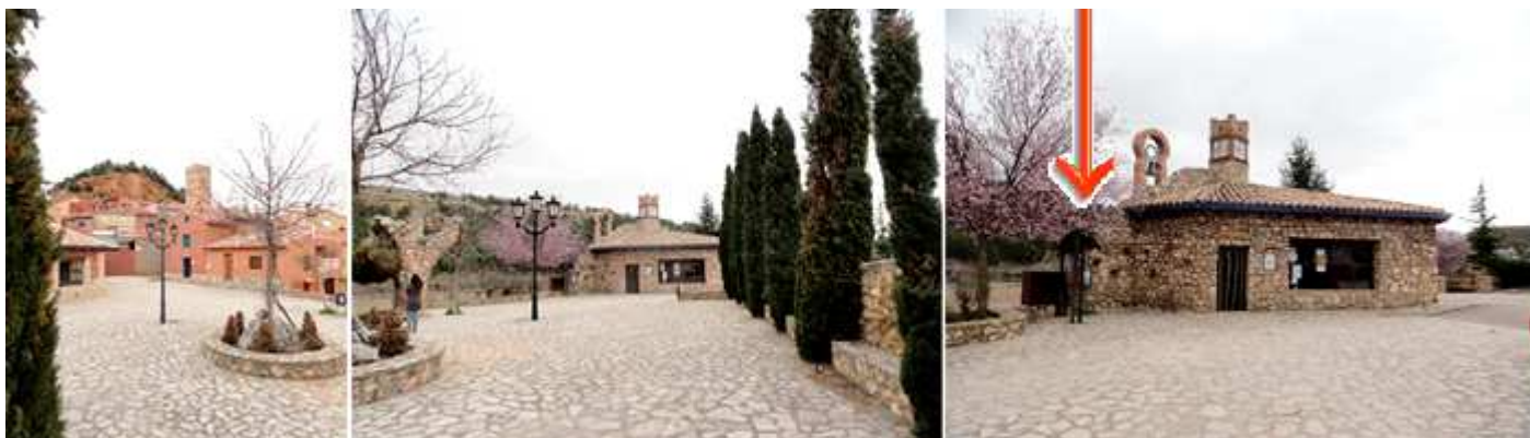
1 La plaza de El Pilón. 2 Con la oficina de Turismo al fondo, 3 A la izquierda de esta oficina la máquina expendedora de las fichas del aparcamiento.

Es un pequeño espacio triangular empedrado con la Oficina de Turismo y una curiosa escultura "empedrada" con forma de árbol.