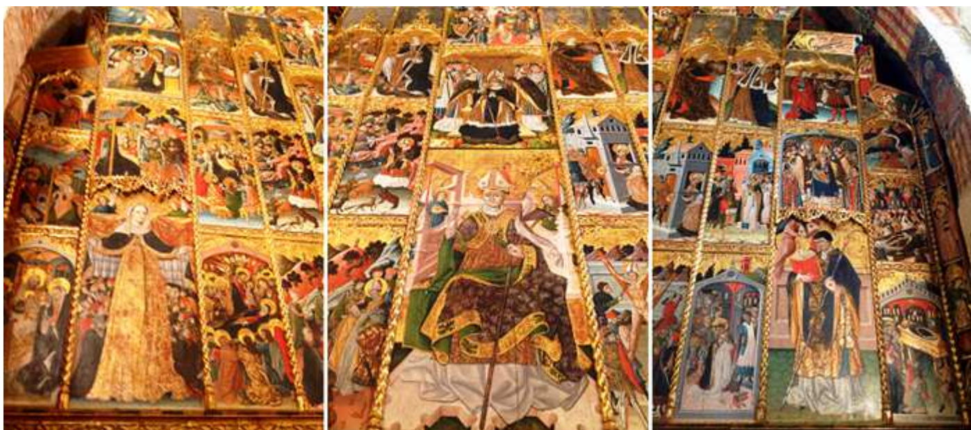
❶ Lateral izquierdo: con la Virgen del Patrocinio, también llamada de la Esperanza. ❷ Calle Central con San Blas. ❸ Lateral izquierdo con Santo Tomás Becquet con un ángel que le pone la mitra. Cada bloque posee tres calles incluida la central.