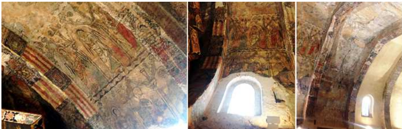
❶ En los arcos fajones los escudos alternados con banderas de Aragón y otras figuras. ❷ La ventana del primer tramo. ❸ A partir del tercer tramo desde la cabecera ya no se han conservado las pinturas.