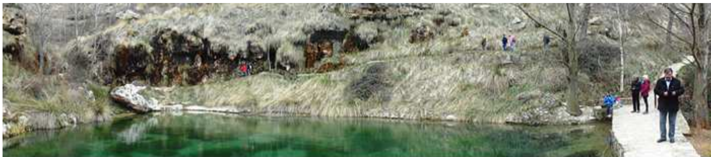
❶ Panorámica de este estanque que en buen tiempo se encuentra poblado de patos.