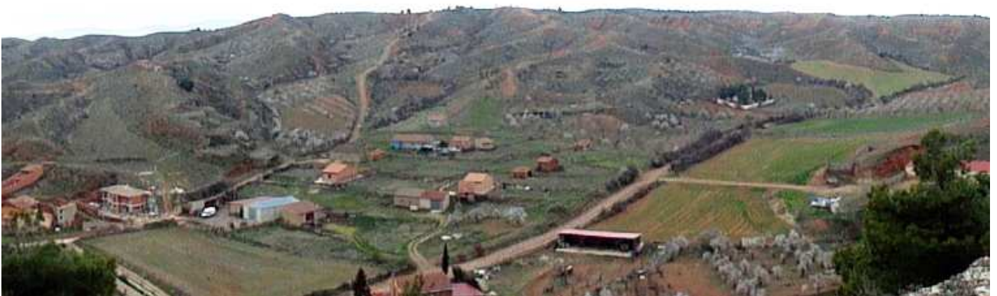
① El paisaje en la parte opuesta del pueblo.

Situado este pueblo en el campo de Romanos que está unido al Valle del Jiloca donde desemboca en el espacio natural del “Aguallueve, se encuentra a 929 de altitud, y a tan solo 5 km, de la Autovía Mudéjar A-23.