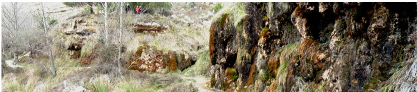
❽ Toda esta parte de la ladera es como una esponja de agua.

La distancia por este lado derecho es casi idéntica al otro, o algo menor, con la particularidad que pasaremos por el merendero existente