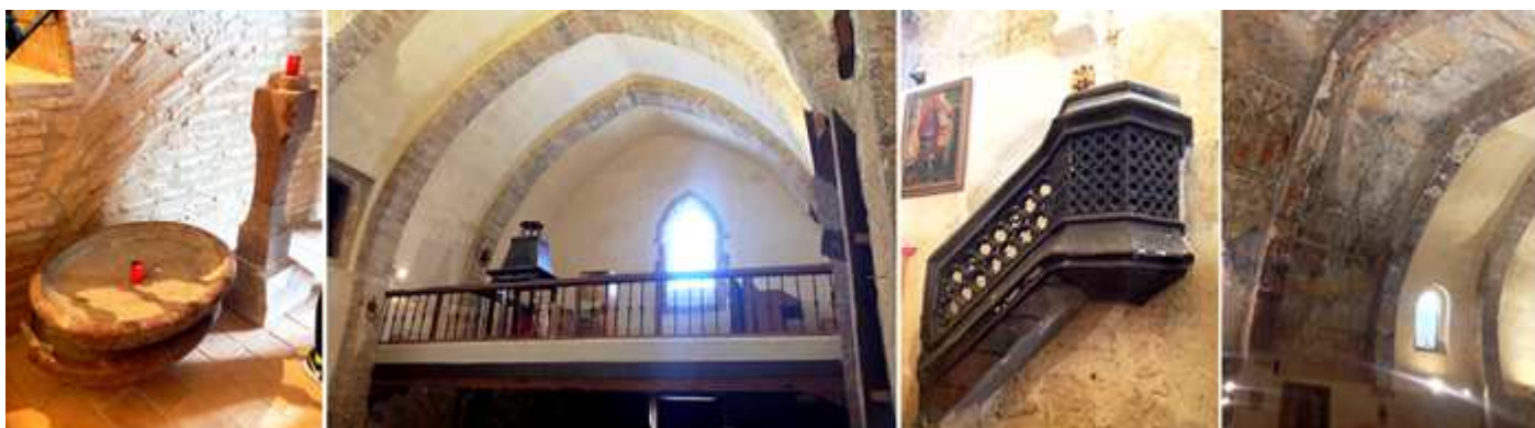
❶ Pila agua bendita de taza plana (en realidad hay dos) que están restaurando con un fustes de sección cuadrada arqueado, a la entrada del templo. ❷ El coro en alto restaurado pero conserva la viga tallada. ❸ Púlpito de yesería con celosía calada mudéjar (decoración de lacería). ❹ Detalle de los arcos fajones y de sus pinturas que en los primeros tramos se han perdido.

Su interior de nave única rectangular con nueve tramos con arcos fajones que soportan su bóveda de cañón apuntado.