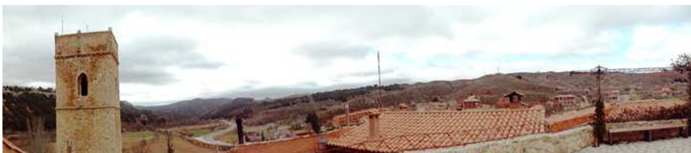
❶ Panorámica con los cabezos pelados y la torre de la iglesia.