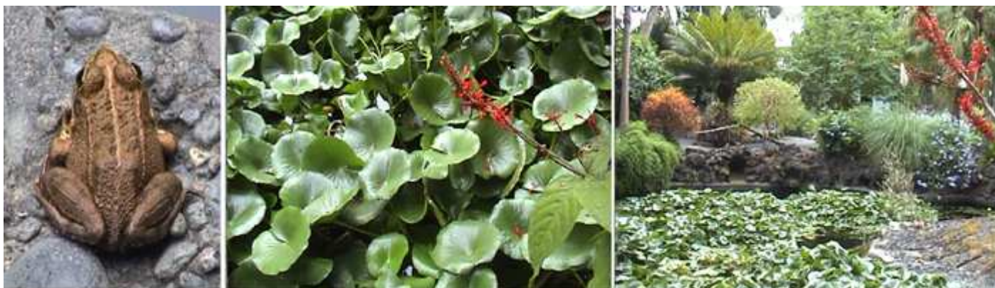
1 Y sus "diferentes" animalitos. 2 Plantas lacustres. 3 Un estanque.

Otro de los árboles que ha conseguido un gran porte es un ficus.