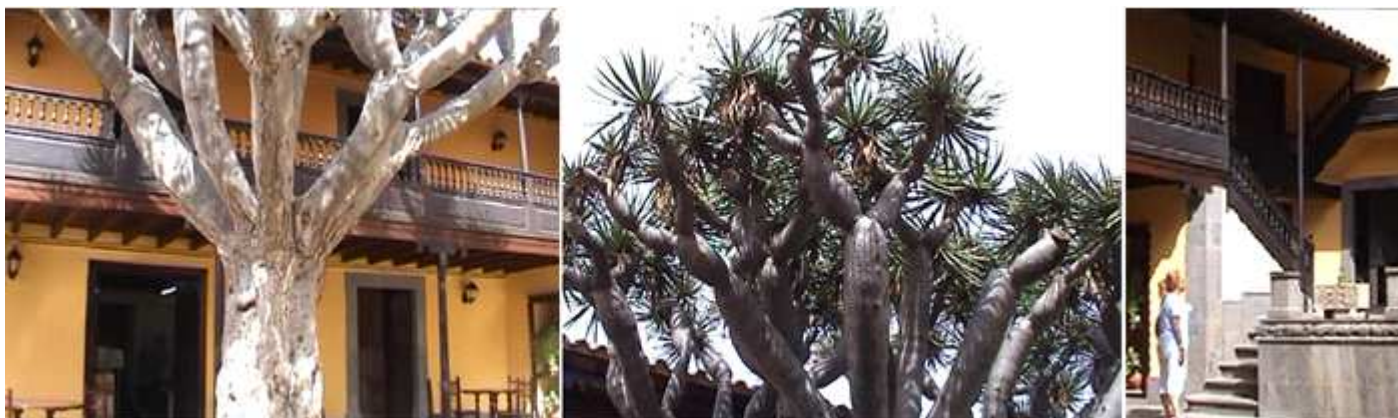
❶ El patio posee un drago. ❷ Que debe de contar con varios cientos de años por el porte que tiene. ❸ Escaleras de acceso a las galerías y la casa.