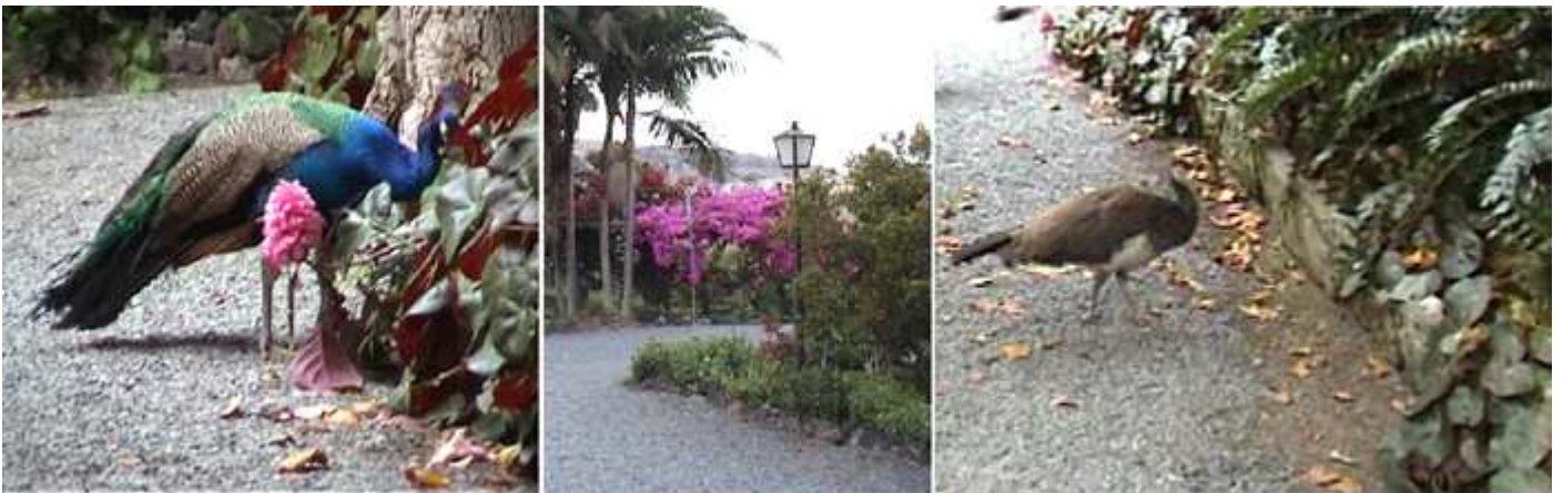
❶ Un pavo real suelto. ❷ Hay rincones que las especies de gran floración llaman la atención. ❸ Otra ave suelta por los jardines.

Posee una colección de araucarias junto a la vivienda que forman una paleta de colores, una gran variedad de palmas de distintas partes del mundo.