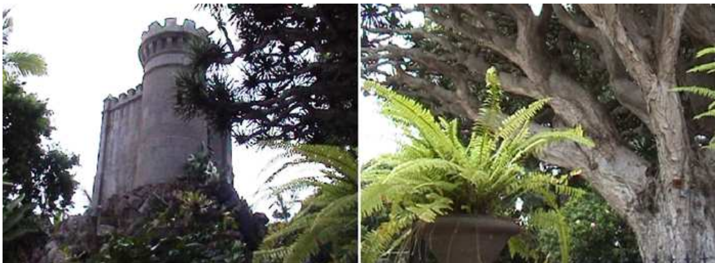
1 Otra parte del jardín con este pequeño torreón. 2 Algunos árboles han conseguido un porte espectacular.

Dispone de más de 500 especies provenientes de los cinco continentes. En estos jardines de trazado irregular.