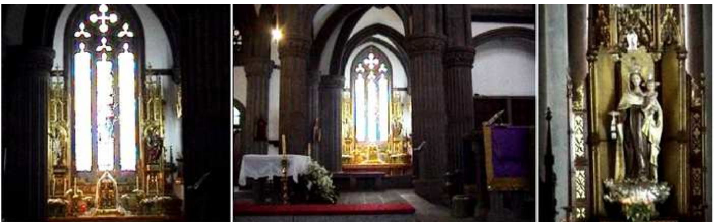
1 Capilla de El Sagrario.