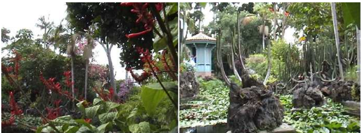
1 Otra zona frondosa. 2 Detalle del quisco junto al lago o estanque.

Una gran tranquilidad, rodea los estanques y arboleda y ofrecen rincones inimaginables.