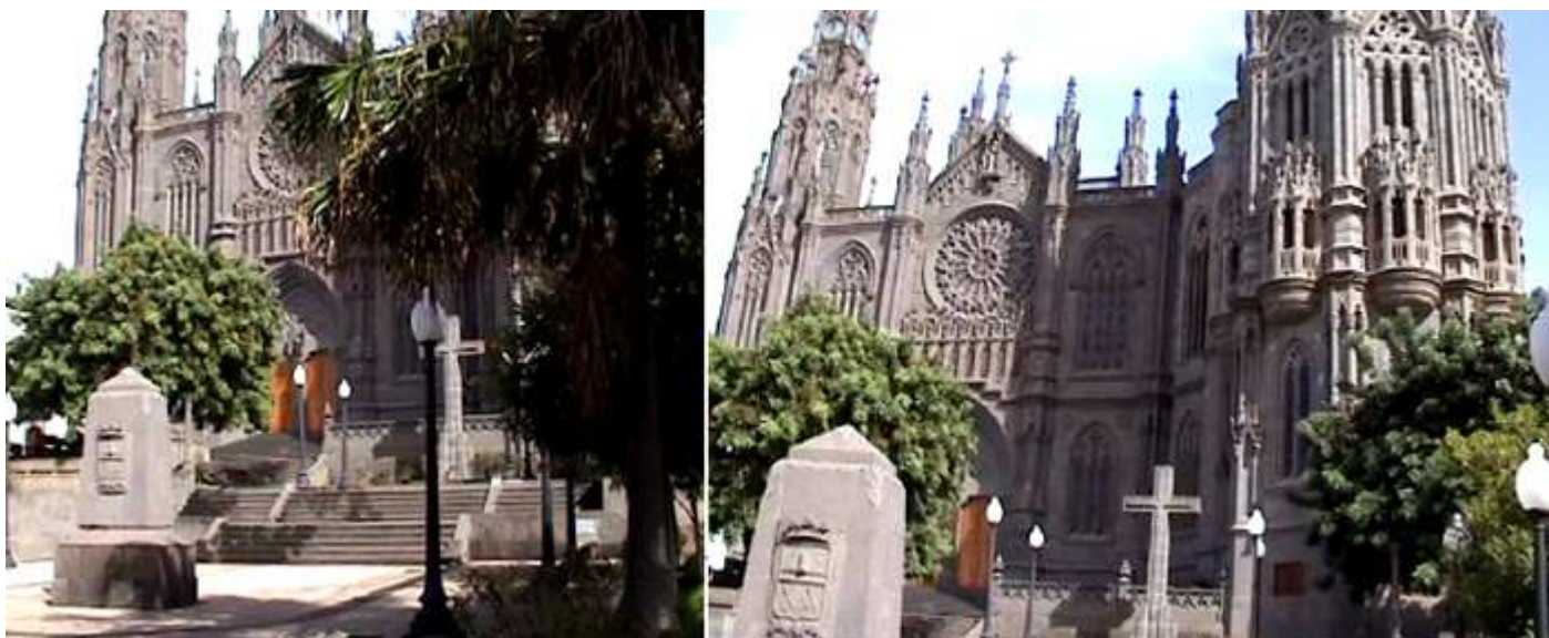
❶ Fachada principal del templo. ❷ La grandiosidad del templo se hace patente desde cualquier lado que se le observe.