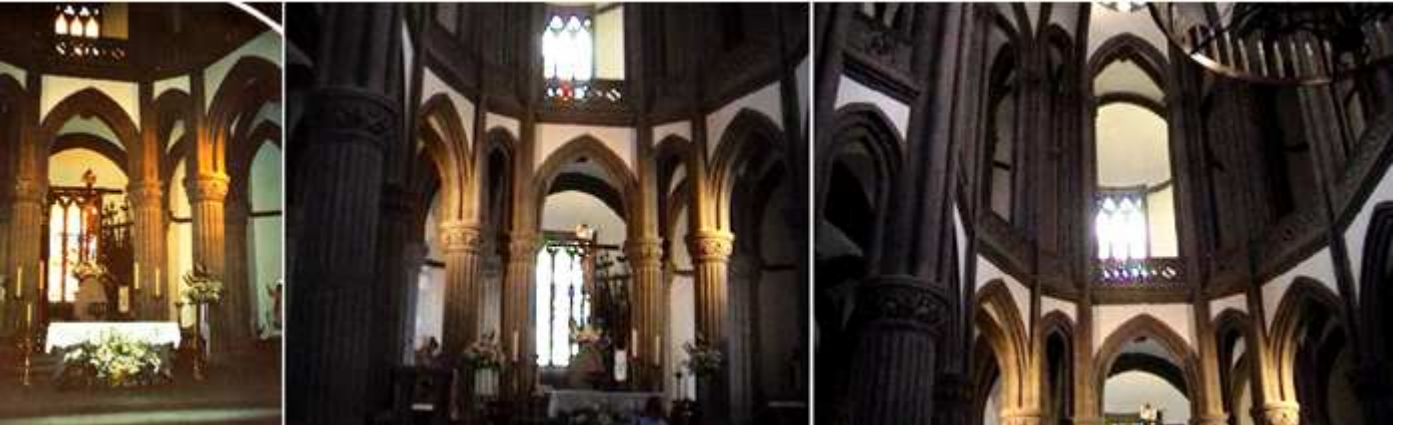
1 Altar Mayor con el Santo Cristo