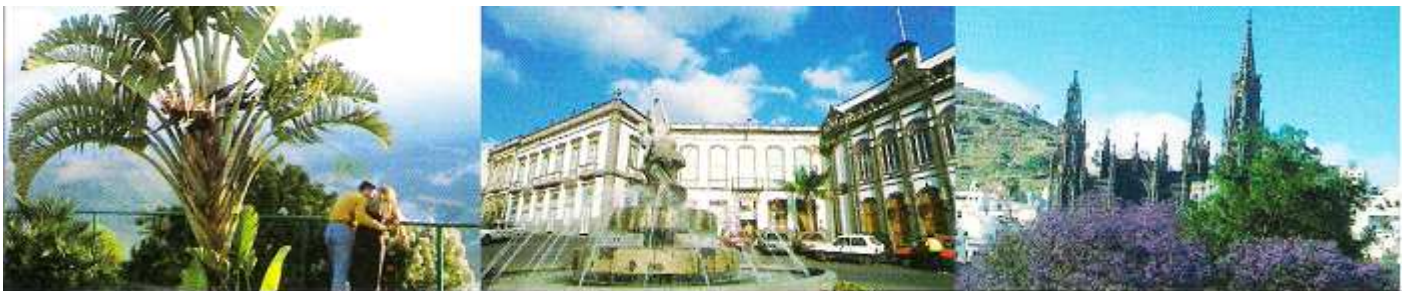
1 Desde el mirador.

Fue fundada a comienzos del S. XVI. Está situada en la fachada norte de la isla, en un valle que fue configurado por un volcán. Y tiene dos parques naturales, el Parque Gourie junto al casco histórico y el Jardín de la Marquesa, del S. XIX, como jardín botánico.