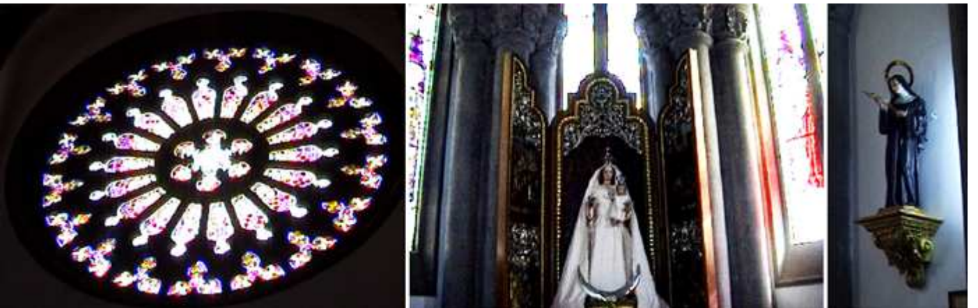
1 Rosetón y vidrieras de lado del crucero del Evangelio.