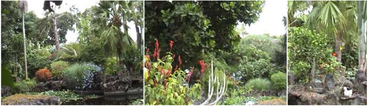
❶ Conviven las plantas tropicales y sub-tropicales. ❷ La mezcla de las especies propicia frondosos parajes. ❸ En los años 90 tuvo una ampliación estos jardines.

Esta zona de montaña con la proximidad del mar, propician un micro clima benévolo para las plantas.