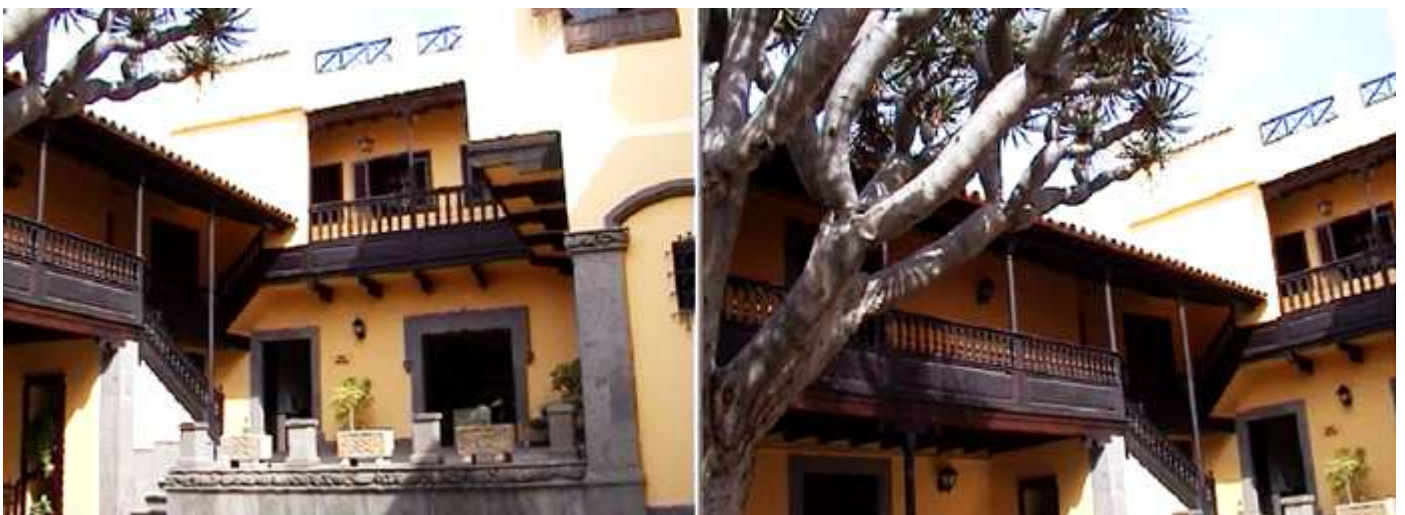
1 La casa dispone de dos plantas. 2 A la izquierda del patio el primer piso cuenta con las típicas galerías canarias.

Se configura esta casa en torno a un típico patio canario interior.