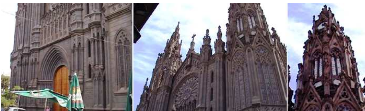
❶ Su puerta ojival abocinada con sus finas arquivoltas. ❷ Sobre la portada destaca su enorme rosetón. ❸ Detalle de una torre.

La Iglesia neogótica se levanta en dos cuerpos, teniendo cuatro fachadas, enmarcadas entre dos torres agudas.