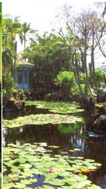
❶ Un colosal drago. ❷ Pequeño quiosco en el centro de uno de los estanques. ❸ Diversas planta acuáticas flotando.