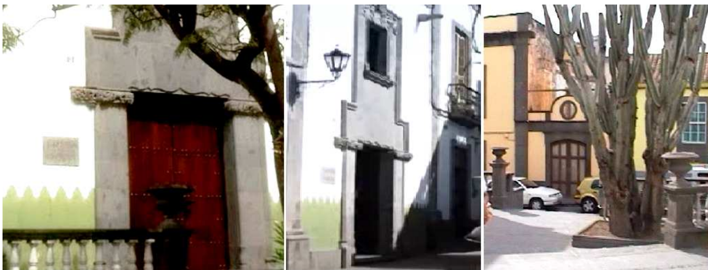
❶ Puerta adintelada de piedra. ❷ Con un alfiz que enmarca también la ventana. ❸ El cactus que hay en la terraza.

Continuamos hasta la Plaza de la Constitución donde se encuentra la Casa Consistorial el parque y el antiguo Mercado.