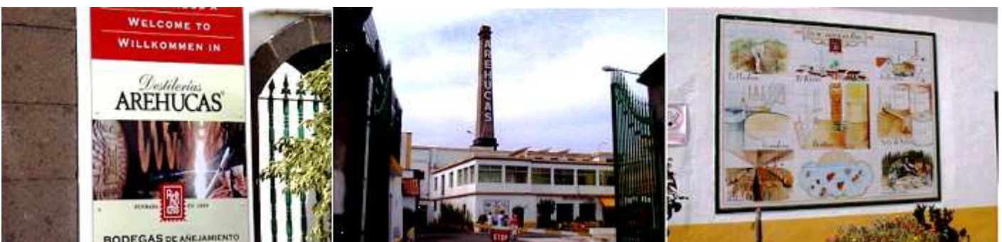
❶ Entrada de la bodega. ❷ Patio de la misma, donde nos reciben para la visita. ❸ Diferentes procesos para la obtención del ron

Esta fabrica fue fundada el 9 de agosto de 1884, su interior es un autentico museo, por las numerosas personalidades que la han visitado y dejado constancia de su presencia.