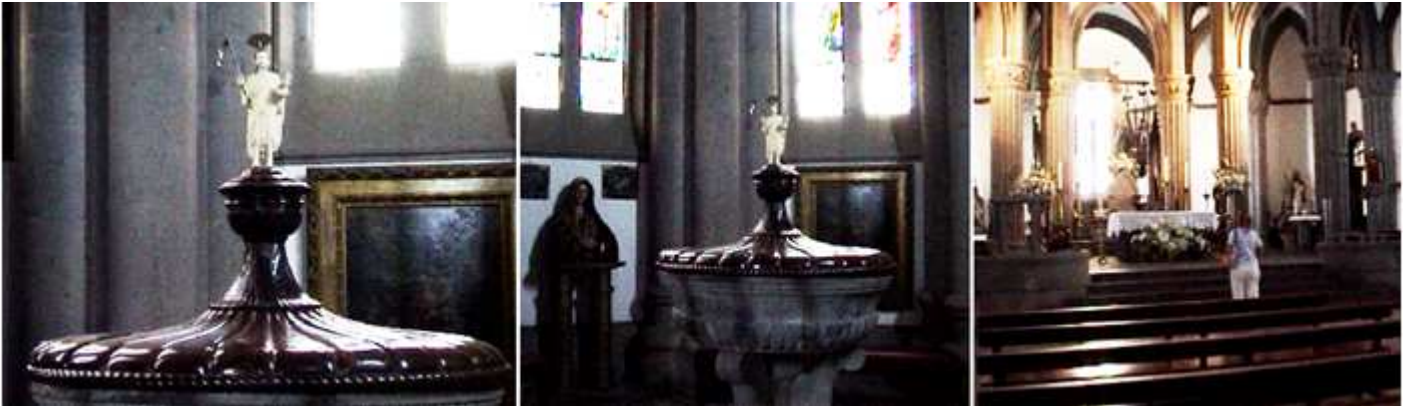
1 Parte superior de la pila bautismal.