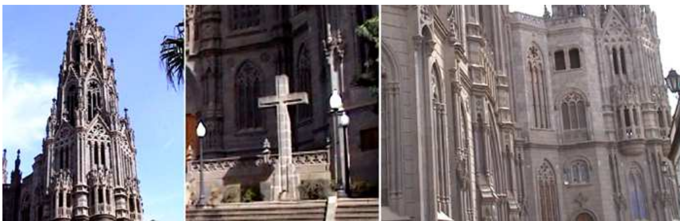
❶ Las agujas de sus torres. ❷ Cruz de piedra ante la fachada. ❸ El estilo gótico de su construcción estiliza sus ventanas y vanos.

La Iglesia neogótica se levanta en dos cuerpos, teniendo cuatro fachadas, enmarcadas entre dos torres agudas.