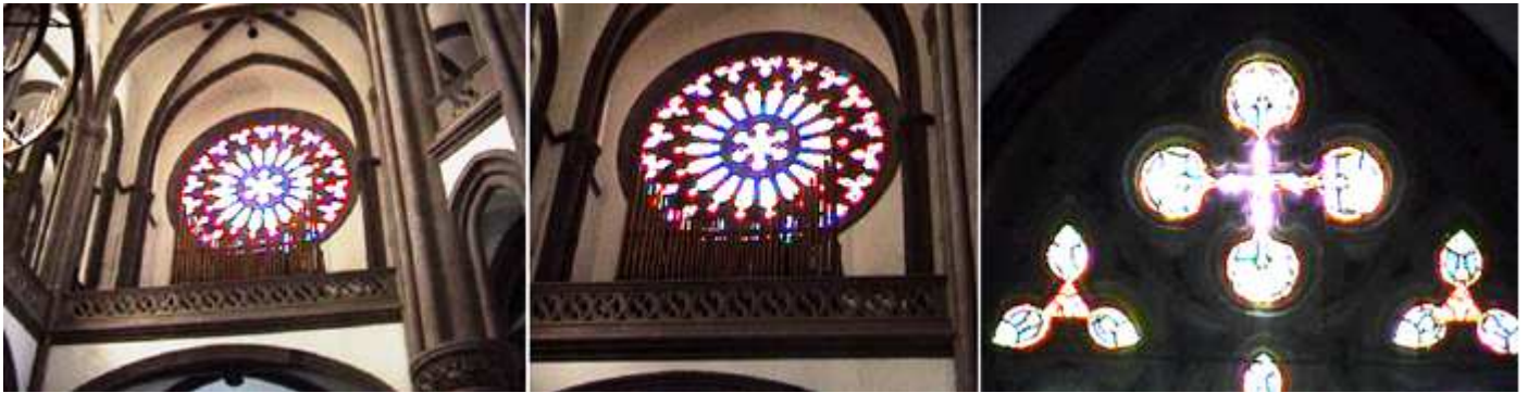
1 El coro alto a los pies del templo sobre un arco rebajado. 2 Donde se encuentra el órgano y un nuevo rosetón con vidrieras. 3 Formas caladas con vidrieras sobre las alargadas ventablas.

Está dotada con hermosas vidrieras, y construida con piedra del lugar.