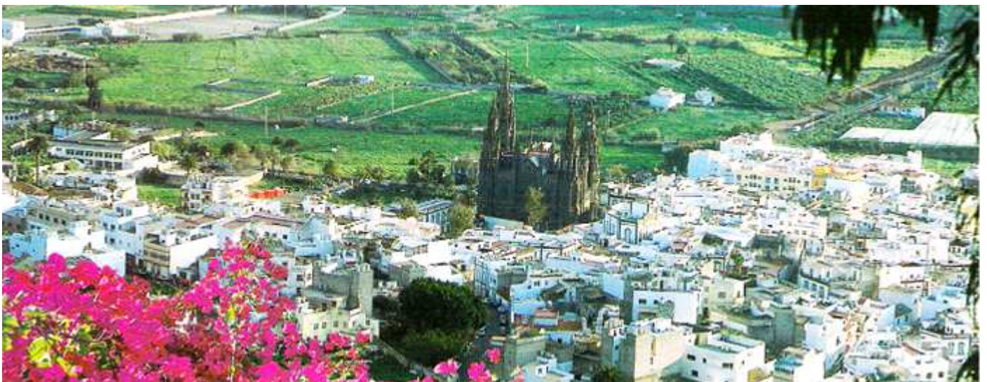
1 Panorámica de Arucas.