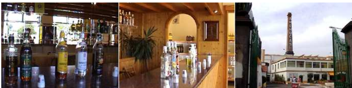
❶ Sala de degustación de sus elaborados. ❷ Al fondo una pequeña tienda para el público. ❸ Y dejamos las instalaciones del Ron Arhuacas.

Es la mayor y más antigua fábrica y bodega de ron de Europa. Su producción ronda los 4 millones de litros.