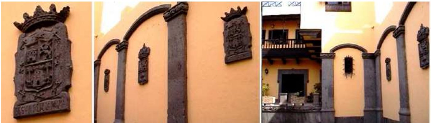
1 Escudo de Las Palmas en el lateral del patio de la casa. 2 Lado izquierdo del patio. 3 Al fondo la entrada a la casa.

El edificio en el que se ubica la Casa de la Cultura, situada en la calle Gourié 3, data del siglo XVII.