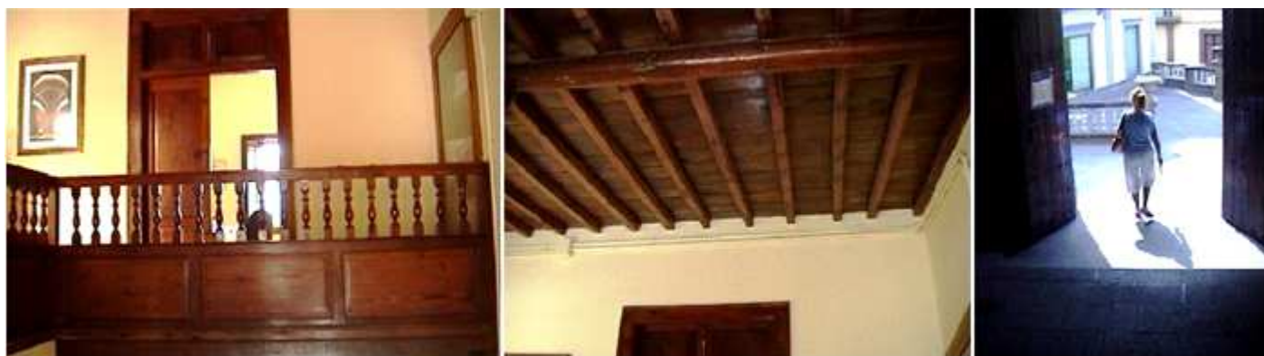
❶ Primer piso con el patio de la escalera con balastrada de madera. ❷ Lo mismo que el artesanado de su techos. ❸ Salida hacia su puerta que tiene una originales impostas talladas.