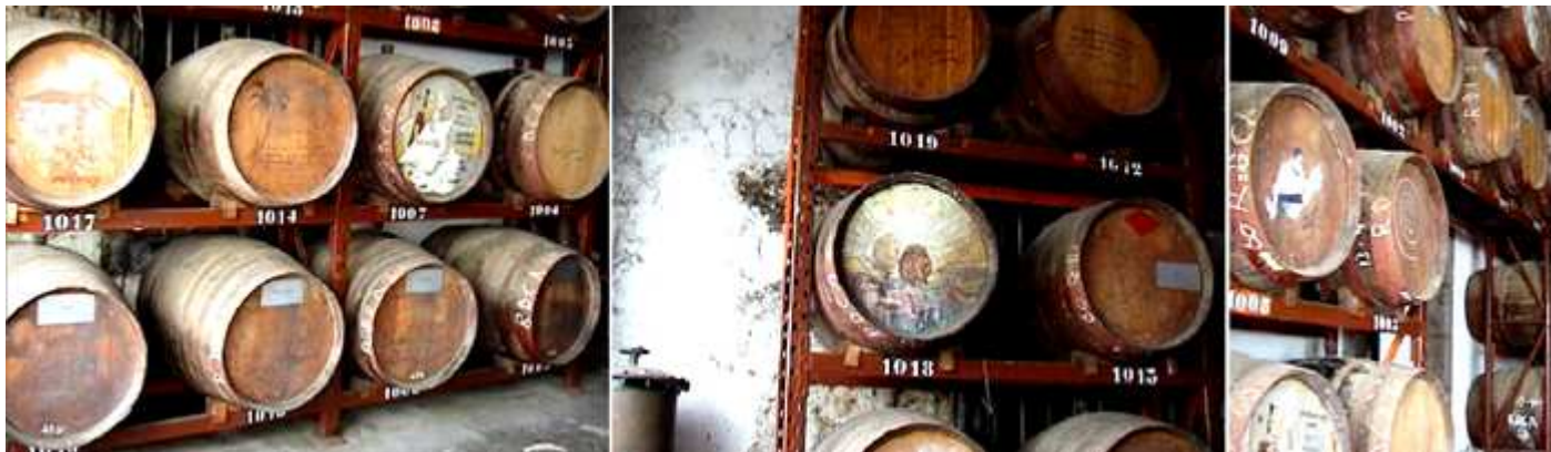
❶ Distintas barricas de roble., dedicadas a los visitantes ilustres de esta bodega. ❷ Algunas de ellas con originales dedicatorias pintadas. ❸ Como testigo de su paso por la bodega.

Para culminar la visita nos ofrecen una degustación de sus productos al final de la visita con todos los elaborados que comercializan.