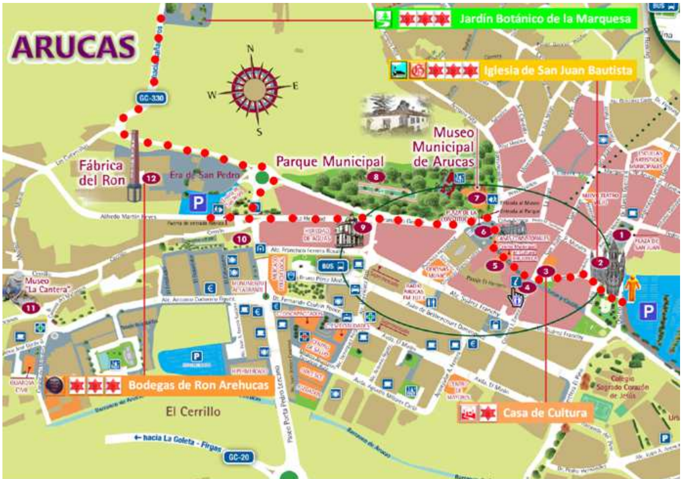
① Croquis recorrido, empleando un plano del Web de Turismo Municipal.

Espero te sea de utilidad esta información.