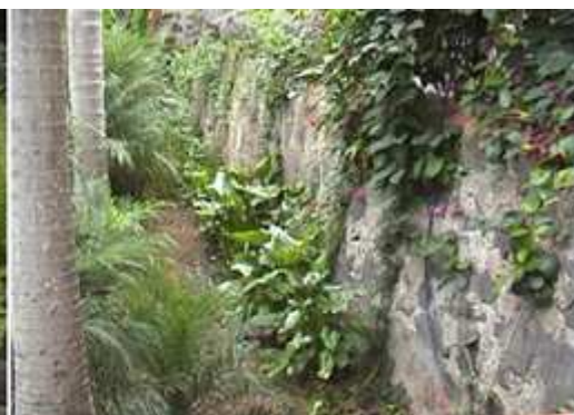
❶ Dispone de una pequeña cafetería cubierta. ❷ Los jardines se encuentran a distintas alturas con la casa. ❸ Un lateral con plantas colgantes.