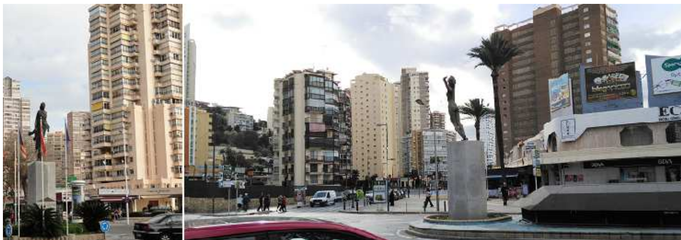
❶ Rascacielos con una oferta increíble de alquiler de apartamentos ❷ O con grandes y modernos hoteles.

La foto fija de sus construcciones con grandes rascacielos, salvo en la zona próxima al mirador del Castillo en Old Town que sus alrededores son la parte antigua.