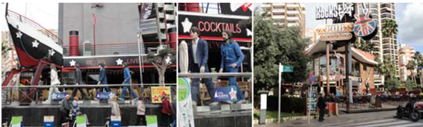
1 Otras imágenes de este colosal Pub Liver Music. 2 Con un buen ambiente musical. 3 Rock Star Pub.

Tapear en las calles próximas a la Iglesia de San Jaime y Santa.. “El callejón de los Gatos” con precios módicos es ir recorriendo de uno en uno de sus existentes.