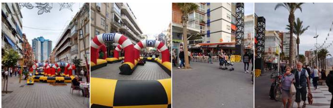
❶ Distintas atracciones expuestas para los niños en la calle Doctor Pérez Llorca. ❷ Los hinchables infantiles. ❸. Junto a la playa en la Avda. de Alcoy. ❹. Otra imagen de esta avenida, donde en Noche Vieja se suceden las actuaciones en las instalaciones que se colocan junto a la playa y que duran hasta altas horas de la madrugada.

Otra de las actividades muy distribuida por la localidad es la gran cantidad de Belenes que exponen los comercios, hoteles, Asociaciones Vecinales y de Belenistas, incluso de los particulares en los portales de sus casas.