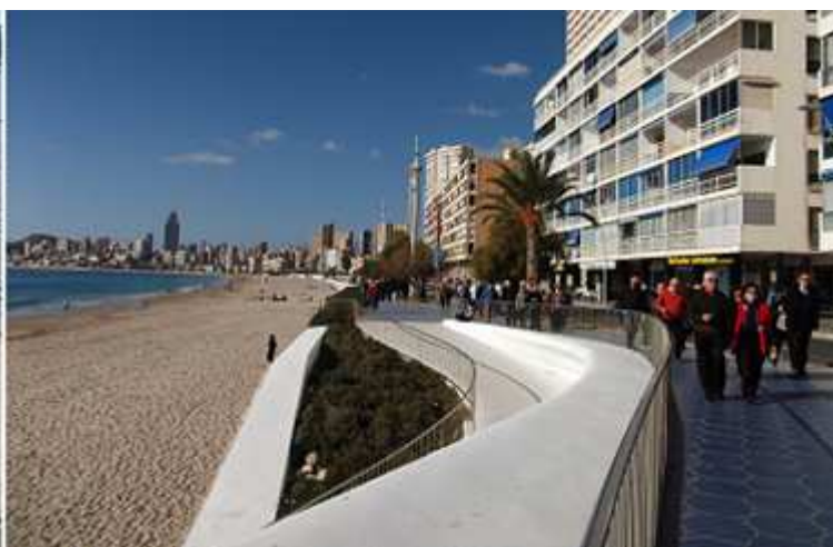
❶ Paseo por la Playa de Poniente junto al Parque de Elche. Con uno de los relojes de sol que posee. ❷ Otra panorámica de la Playa de Poniente, con la silueta al fondo del edificio del Hotel Bali. Playas que en invierno el sol las baña hasta su puesta.