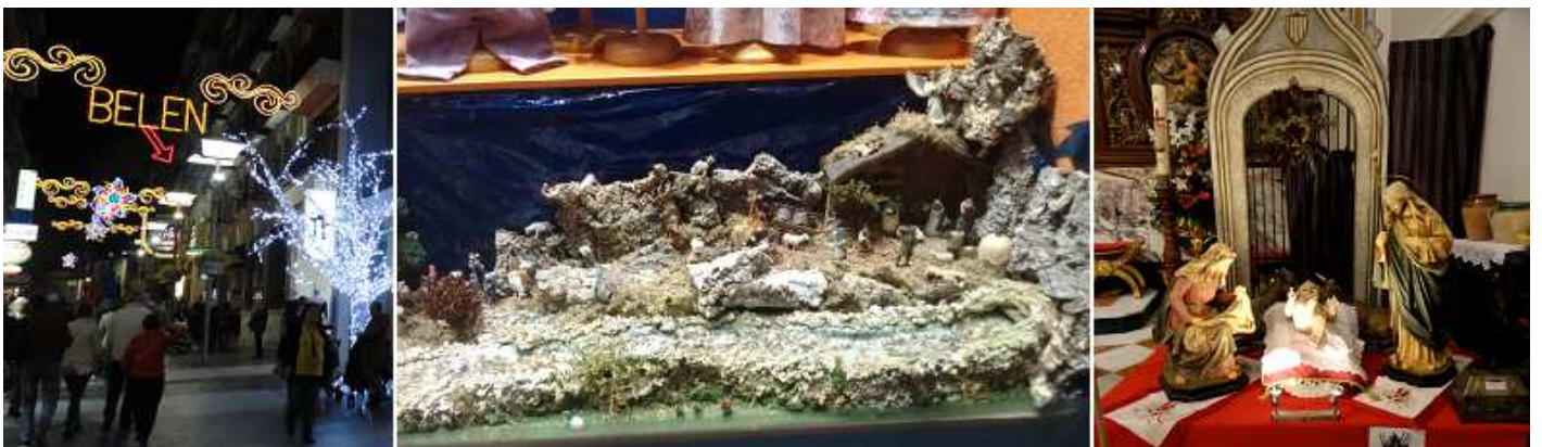
❹ Algunos de los Belenes suelen estar señalizados. ❺ Belén de Cristis Bay. ❻ Belén de la Iglesia de Santiago y Santa Ana.

Otro de los belenes que tienen mención por su visita.