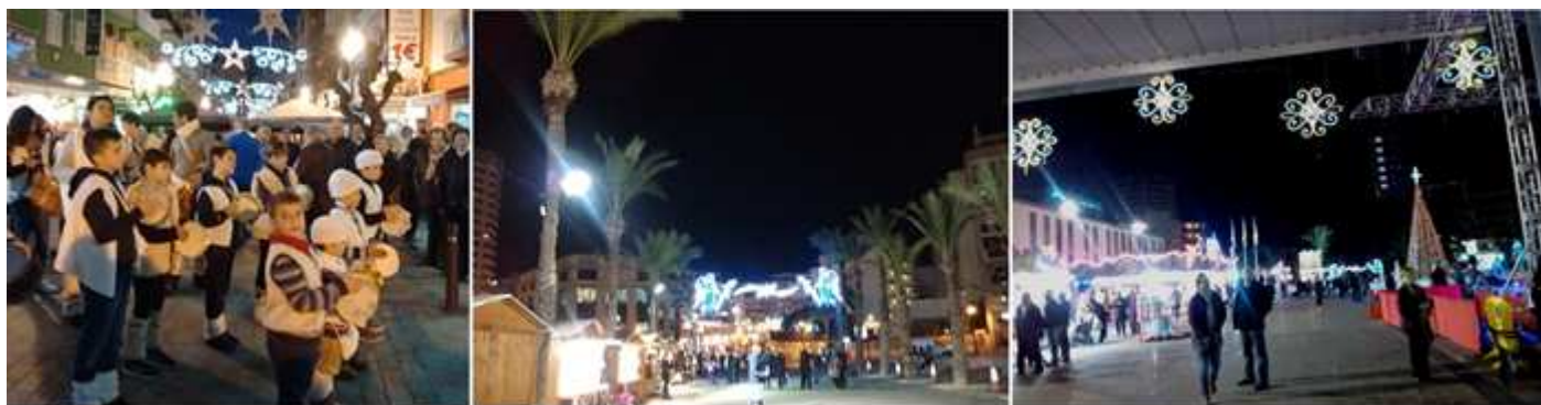
❶ Grupos de niños entonando villancicos con sus panderetas. ❷ El ambiente se completa con la iluminación de sus calles. ❸ Que dispones de formas variadas.

Quizás sea esta una fórmula para atraer a matrimonios jóvenes con niños, pues por la atracción están con bastante animación de Niños.