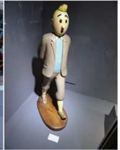
❶ Grupo de tres barcos de madera y tela. Col Farmacia Luz. ❷ Caballo sin policromía. Madera. Col. Farmacia Luz. ❸ Tintín. Madera. Col. Farmacia Luz.

Por dejamos el museo y os propongo otra zona para tomar unas copas o cervezas, donde la animación está asegurada por la noche.