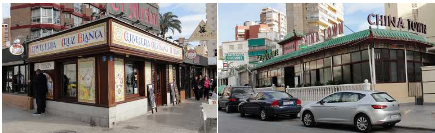
1 El Mesón, cervecería. Con cocina de mercado 2 O el China Town

Y por poner otra zona en este caso para unos platos distintos y rápidos en la zona de la calle Esperanto.