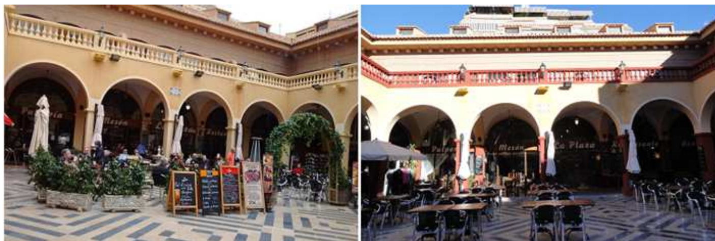
1 Terrazas de la Plaza Mayor. 2 Donde tomar el aperitivo con una fritura, o mejillones en diversas preparaciones..

Otras de las zonas es junto a la Plaza Mayor en su interior y las calles inmediatas donde está la Mejillonera otro de los establecimientos que destacan por su calidad.