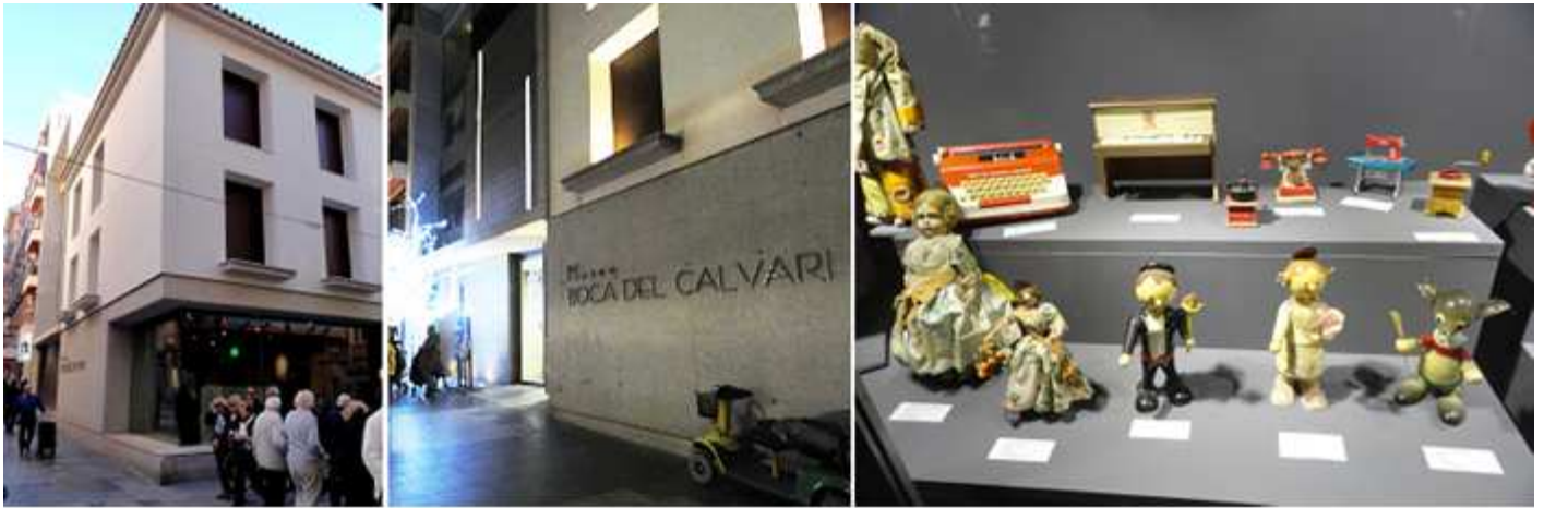
❶ Esquina del Museo junto a la calle Paseo de la Carretera. ❷ Fachada lateral con su puerta de acceso. ❸ Conjunto de muñecos y otras piezas infantiles como una máquina de escribir de juguete.

En el que encontramos una preciosa muestra de juguetes antiguos de coleccionistas y asociaciones.