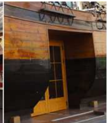
❶ La Taberna más pirata de Benidorm ❷ Nitht Club Morgan Tavern. Con la silueta de un casco de un veleros con sus tres mástiles junto a la acera.

Desde que vence la tarde hasta altas horas de la madrugada son los templos del ocio nocturno local.