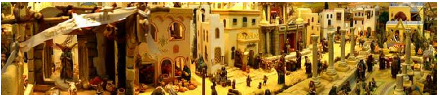
❼ Belén de la Asociación la Barqueta.

Otro de los belenes que tienen mención por su visita.