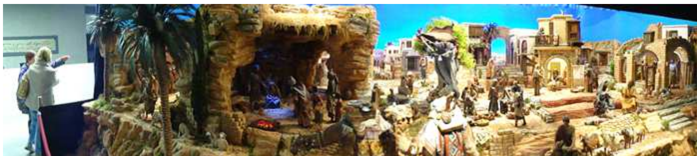
❶ Belén del Museo Boca del Calvario situado en su planta calle.

Además de los Belenes que suelen estar en todos los templos, aquí incluyo algunos de los más originales por su forma, tamaño, figuras y /o el empleo de materiales de los más variado.