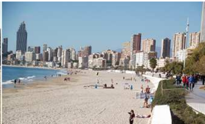
❶ La ancha playa junto al Parque de Elche.