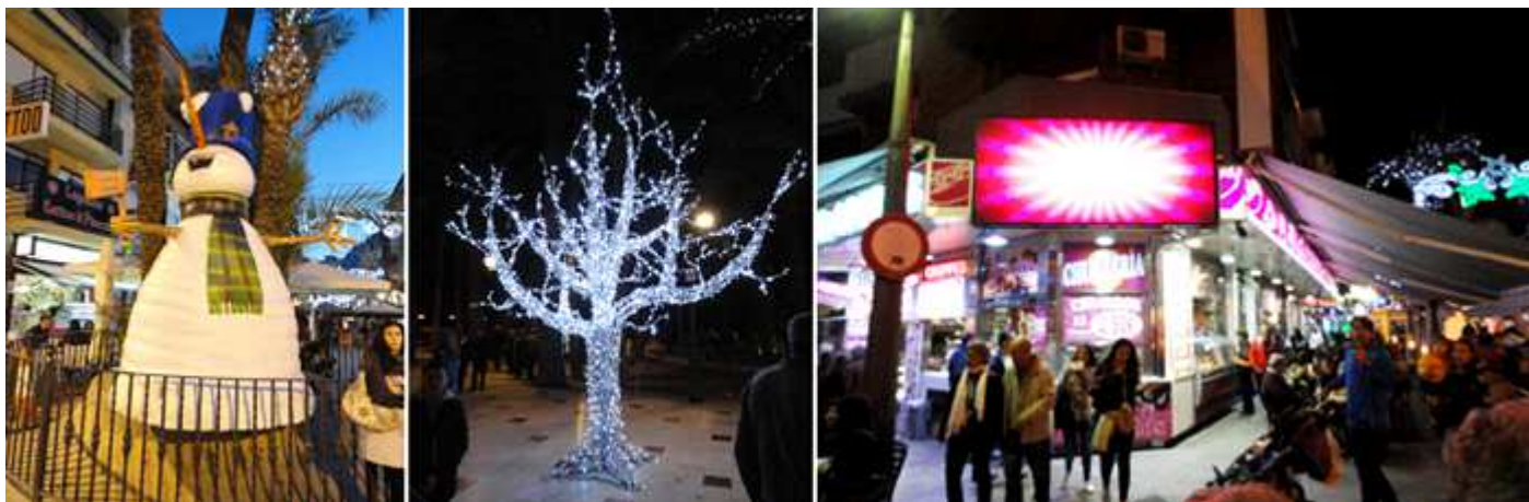
❶ Las zonas con ambiente navideño son numerosas y mas para los niños. ❷ Cualquier paseo o plaza decoran con motivos que dan un ambiente Navideño desde antes de comenzar las Navidades. ❸ Y como no? En la zona más populosa para todas las edades, por las veces que se transita por ella. El Paseo de la Carretera, esquina con la Avenida Martínez Alejos. Con grandes terrazas en la misma calle.

Tanto para grandes, pero sobre todo para los pequeños en distintos lugares de plaza y calles, aspecto de agradece para los matrimonios con hijos