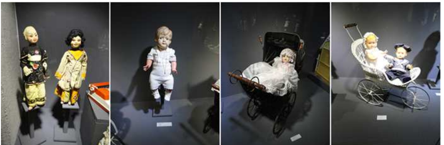
❺ Pareja muñecos de trapo. ❻ Muñeco Japonés, de celuloide. Años 40. Col. Vicenta Pérez Bayona. Ⓣ Carrito de muñecas, modelo de metal y tela. Años 40 Col. Vta. Pérez Bayona. Ⓤ Carrito para dos muñecos, mimbre y metal. Siglo XX. Col. Vicenta Pérez Bayona

El museo cuenta con una planta sótano, la de la calle y dos superiores, que además cuenta con ascensor para las personas disminuidas.