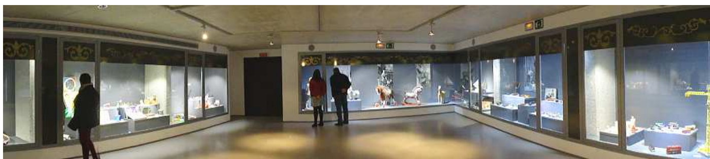
❶ Panorámica de esta nueva planta.