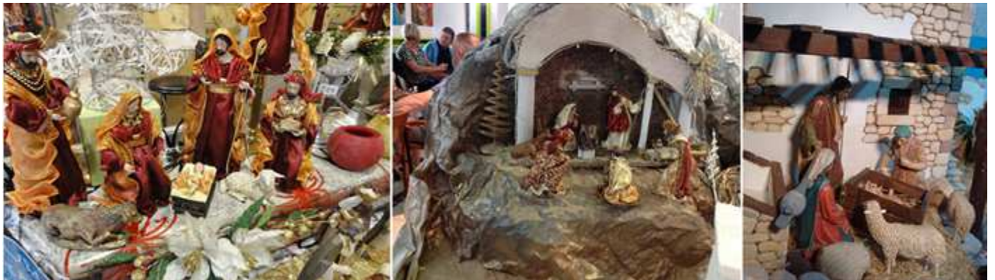
❶ Belén del comercio Arte Vela.