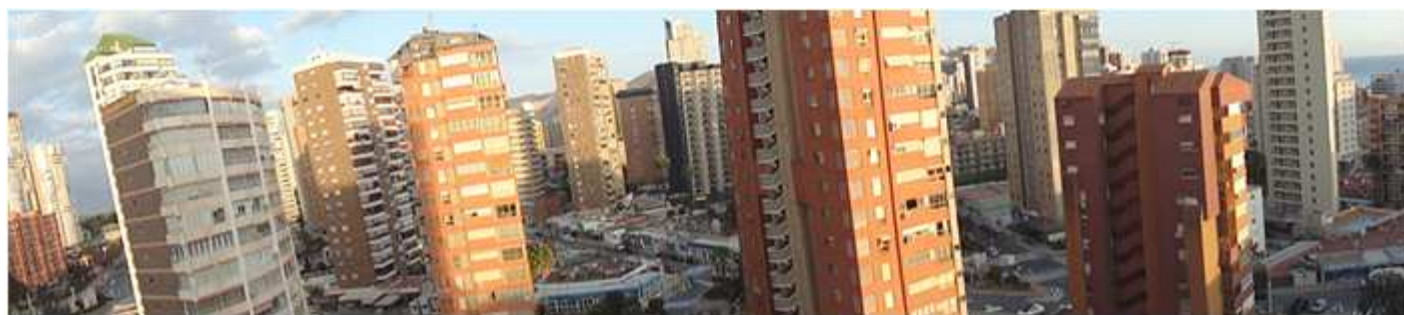
❸ La visual de Benidorm en su interior es la de enormes rascacielos con miles de apartamentos.

Después de este recorrido que nos da la talla de su moderna construcción, nos vamos a internar en su núcleo central entre las dos playas la de Poniente y la de Levante. Aunque a buen seguro la repetición de pasear y de acudir a sus restaurantes, o el tapeo de las tardes es inevitable.