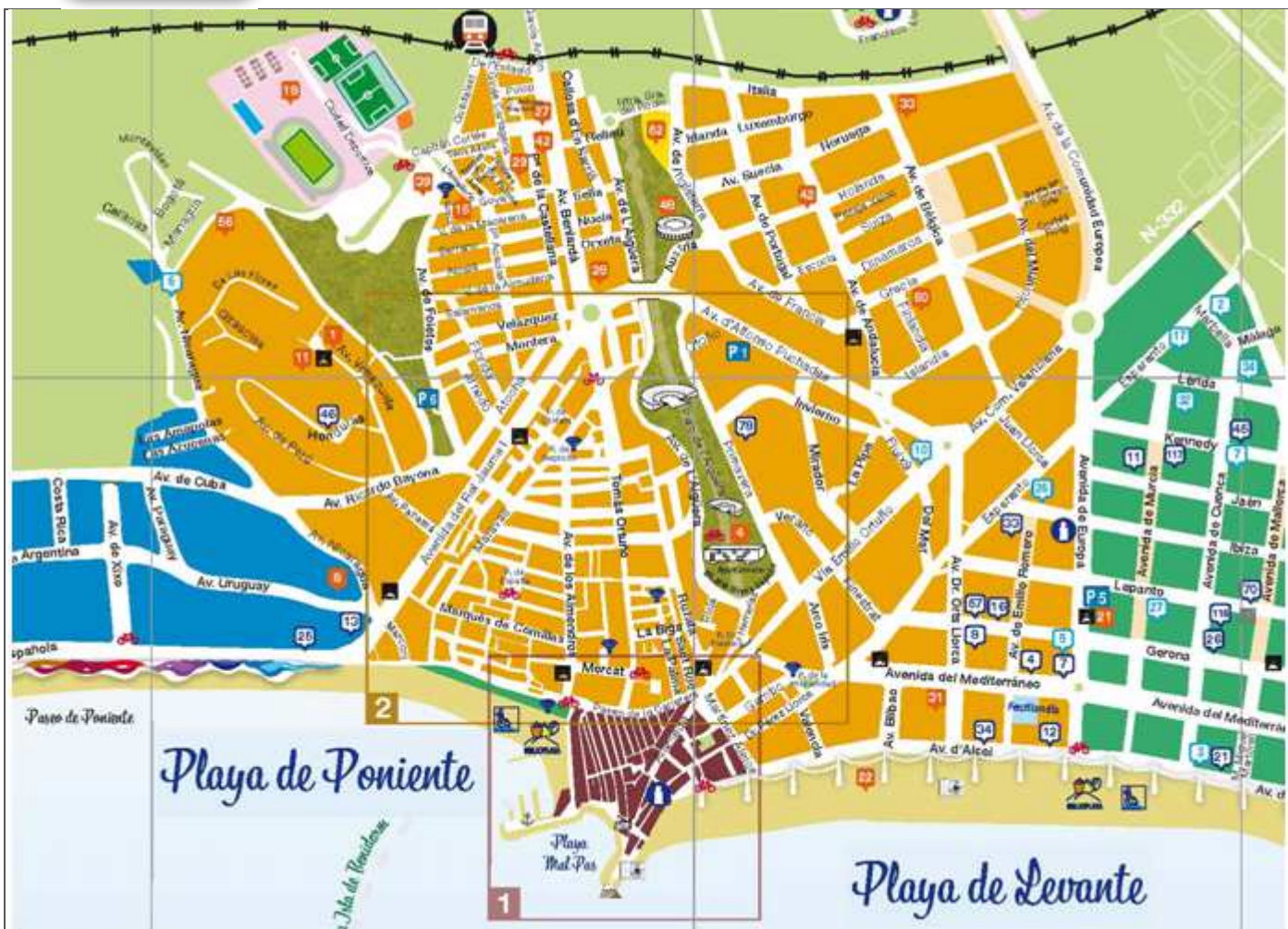
Croquis itinerario visitas, plano empleado de un folleto de Turismo