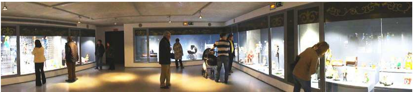
❹ En cada planta unos amplios escaparates nos muestran el conjunto organizado por tipos y actividades de usos de los juguetes por los niños.

Hay que resaltar la actividad Juguetera que ha tenido y tiene esta provincia valenciana, en la que tanto los juguetes de resortes mecánicos y efectuados en hoja delata xerografiada, como lo referente a muñecas y sus complementos durante muchos lustros ha sido la actividad productiva y exportadora a todos los confines del mundo.