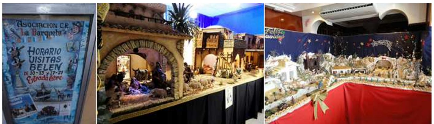
❽ Cartel horario visitas de la Asociación La Barqueta. ❾ Belén Asociación La Marina. Ⓤ Belén Hotel Cristal.

Con estos belenes ponemos punto a otro tipo de visitas que se pueden realizar sobre todo en horario vespertino.